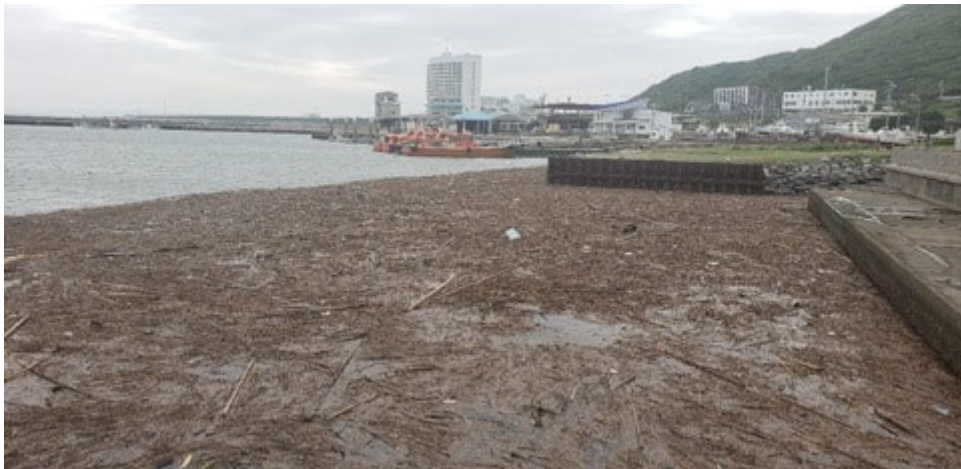
愛知県伊良湖港港内 流木漂着状況