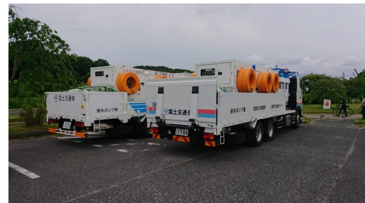
ポンプ車入れ替え(6月13日)

https://www.cbr.mlit.go.jp/toyohashi/oshirase/rinjicamera.pdf