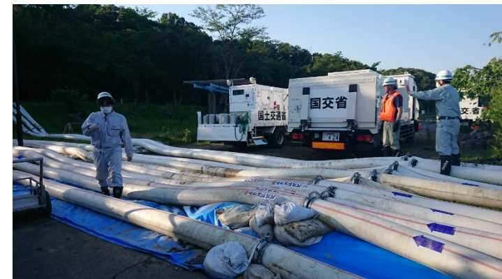
ポンプ設置状況(5月29日)

https://www.cbr.mlit.go.jp/toyohashi/oshirase/rinjicamera.pdf