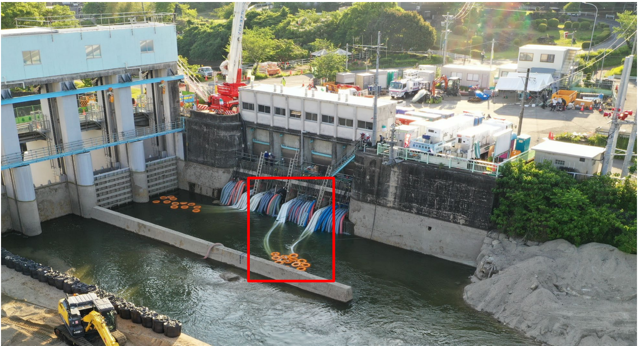
排水ポンプ車① 令和4年5月24日 ポンプ稼働中