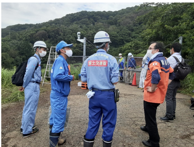
関係機関との現地打合せ