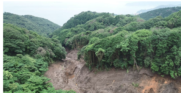
源頭部から下流を撮影