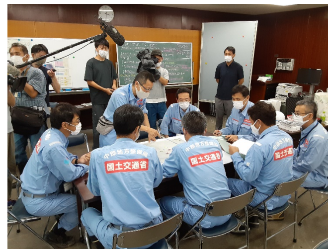
到着後、現地の総括班と打合せ