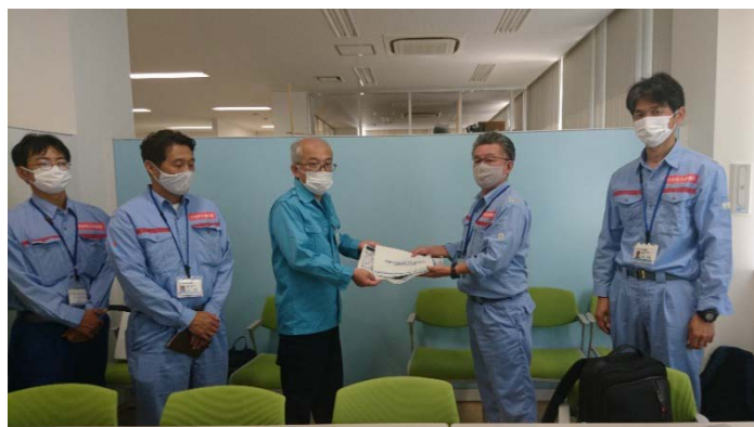
熱海市へ調査結果を報告