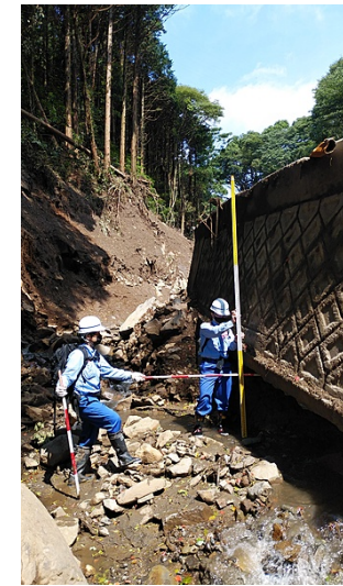
砂防堰堤の被災箇所の調査