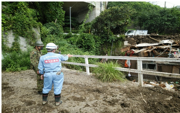
自衛隊との現地打合せ