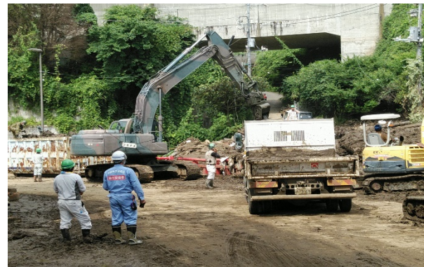
啓開作業の現地調査