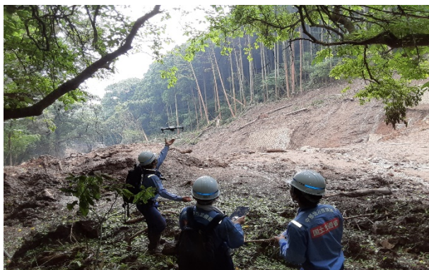
ドローンを活用した砂防堰堤上流部の点検