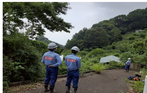
ドローンを活用した土石流危険渓流点検