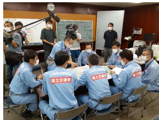
到着後、現地の総括班と打合せ