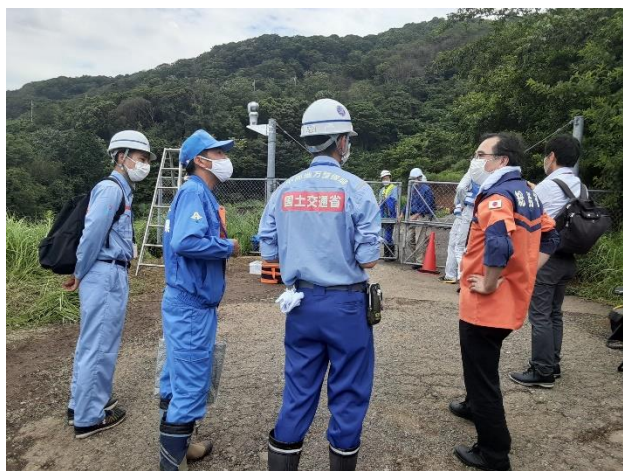
関係機関との現地打合せ