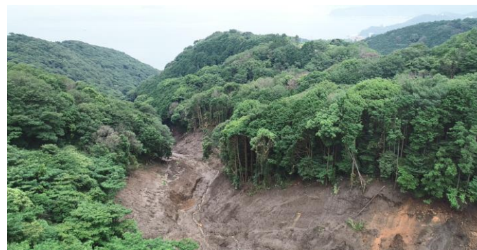
源頭部から下流を撮影