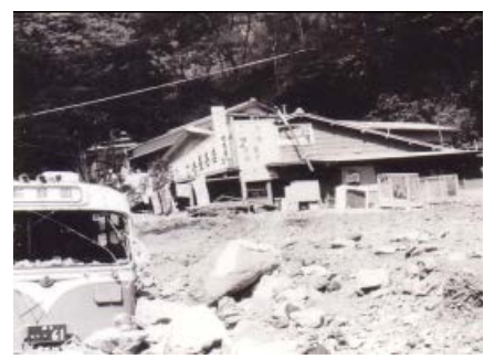
昭和41年梅ヶ島災害による被害 (静岡市葵区梅ヶ島温泉)