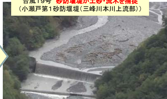
台風19号 砂防堰堤が土砂・流木を捕捉 (小瀬戸第1砂防堰堤(三峰川本川上流部))