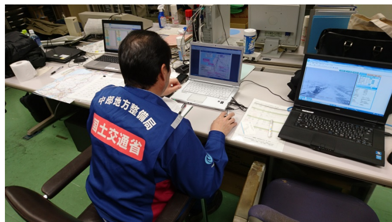
福井国道維持出張所での打合せ及び執務状況