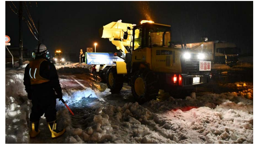
坂井市道における除雪活動