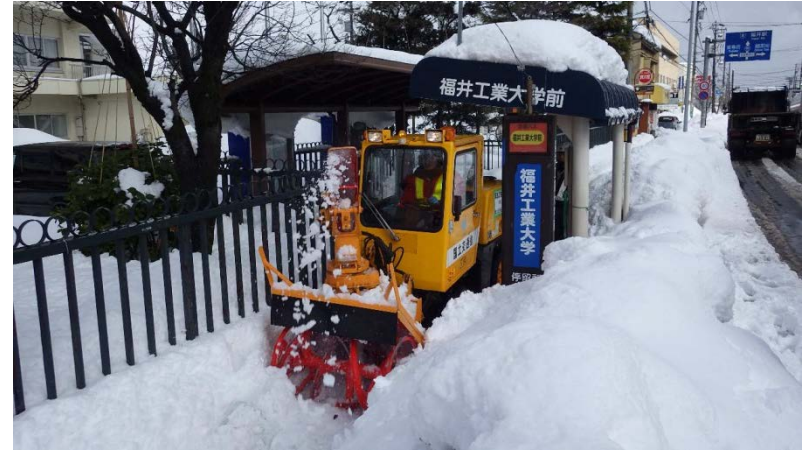
福井市道における除雪活動