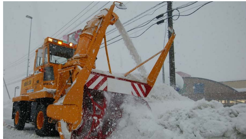
国道8号線（福井市・坂井市）にて車両滞留解消・通行止め解除に向け活動