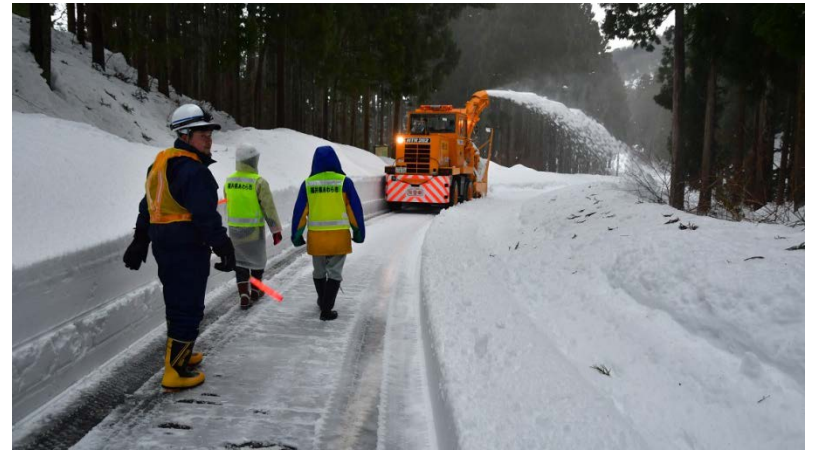
あわら市道における除雪活動