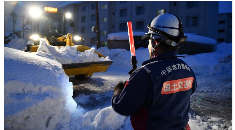
鯖江市道における除雪活動