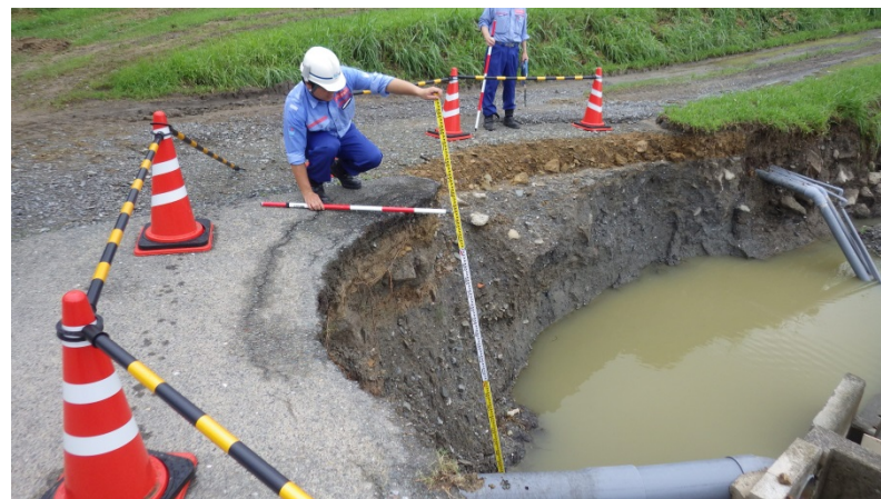
朝倉市鳥集院地区被災状況調査（道路調査班）