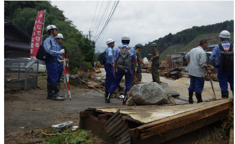
自衛隊と共に（河川調査班、道路調査班）