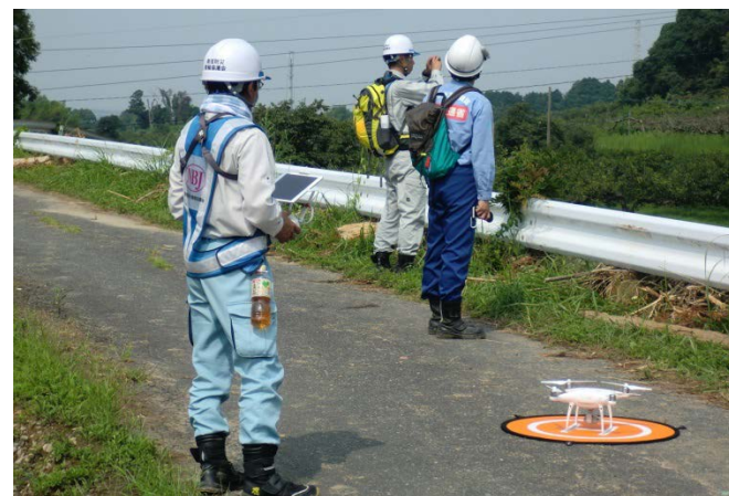
ドローンを飛ばして被災状況調査（砂防調査班）