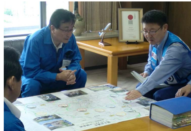
日田市長への被災状況調査の中間報告（砂防調査班）