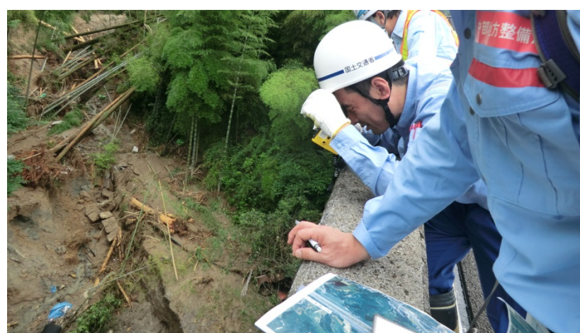
朝倉市大分自動車道より崩落箇所調査（砂防調査班）