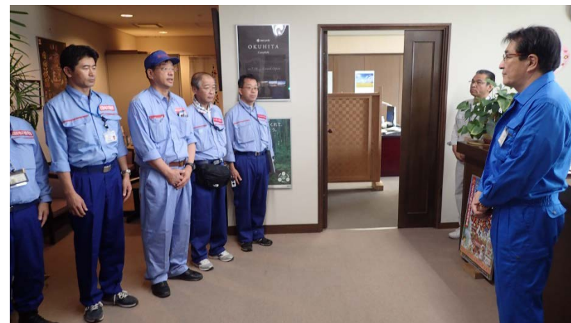
日田市役所にて日田市長の激励（砂防調査班）