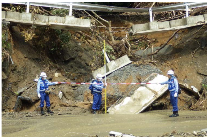
朝倉市奈良ヶ谷川被災状況調査（河川調査班）

「平成29年7月九州北部豪雨」による被災地復旧支援のため、中部地方整備局は、TEC-FORCE（緊急災害対策派遣隊）として、引き続き朝倉市の被災状況を調査しています。