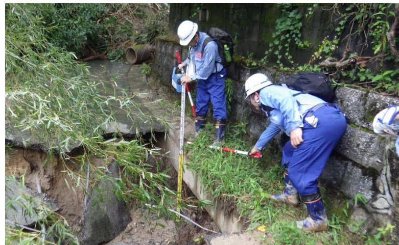
朝倉市杷木志波 現地調査（道路調査班）