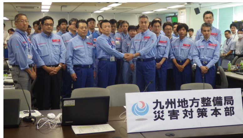
九州地方整備局長へ活動状況を報告 [平成29年7月20日]