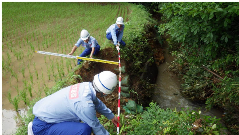
ドウデ川の現地調査①（河川調査班）

九州地方の豪雨災害による被災地復旧支援のため、中部地方整備局は、TEC-FORCE（緊急災害対策派遣隊）として、現在24名（総括班4名，河川調査班8名，道路調査班8名，砂防調査班4名）を派遣し、引き続き、福岡県朝倉市周辺の被災状況を調査しています。