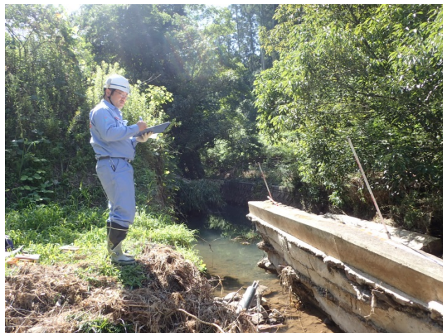
日田市松野川被災状況調査（砂防調査班）