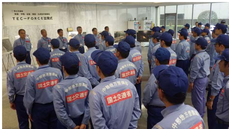
九州地方整備局にて5地整合同出発式