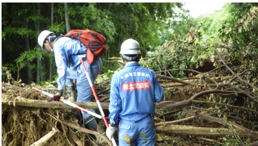
朝倉市道2490号線被災状況調査（道路調査班）