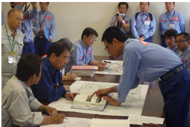
朝倉市長へ被災状況調査の報告（河川調査班）

「平成29年7月九州北部豪雨」による被災地復旧支援のため、中部地方整備局は、TEC-FORCE（緊急災害対策派遣隊）として、引き続き朝倉市の被災状況を調査しています。