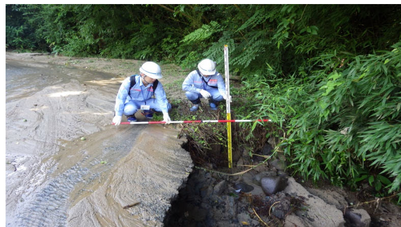
政所川被災状況調査（河川調査班）