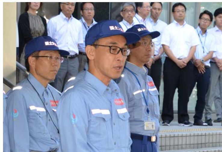
派遣にあたり塚原局長から激励