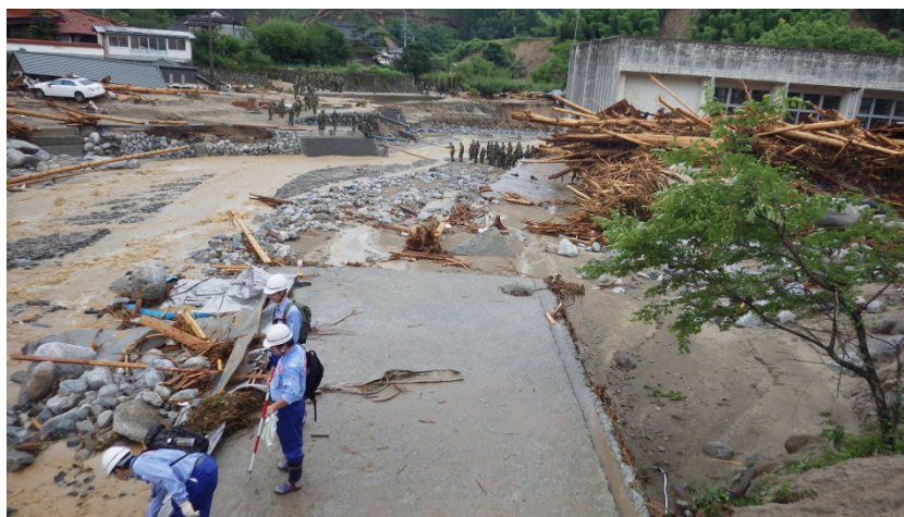
朝倉市乙石川付近の現地調査（道路調査班）