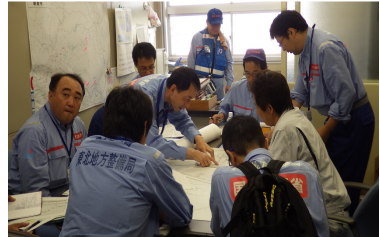
朝倉市役所にて調査結果報告（河川調査班）