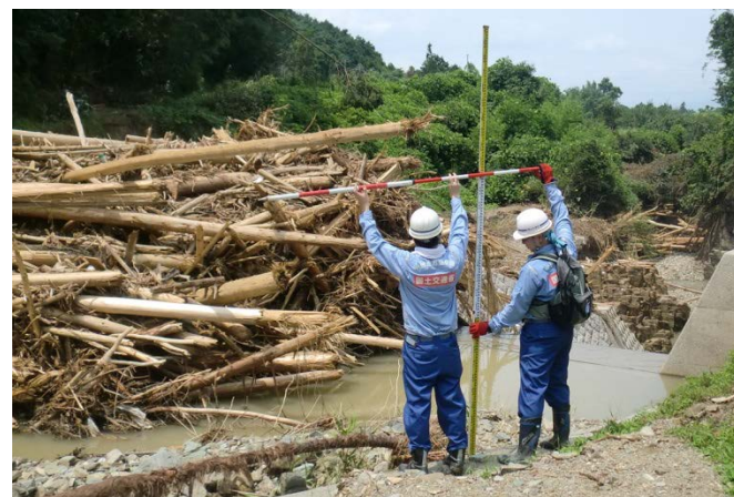
朝倉市妙見川の被災状況調査（砂防調査班）