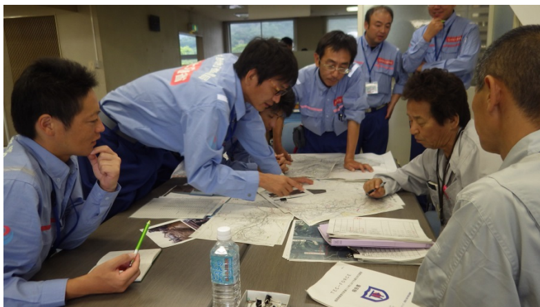
朝倉市役所との打合せ（河川調査班）

九州地方の豪雨災害による被災地復旧支援のため、中部地方整備局は、TEC-FORCE（緊急災害対策派遣隊）として、引き続き、福岡県朝倉市周辺の被災状況を調査しています。