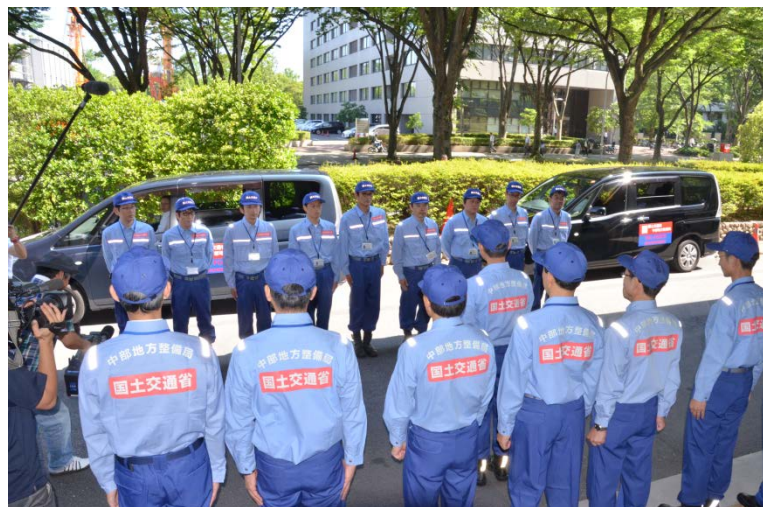
河川調査班、道路調査班、砂防調査班 出発式

その復旧支援のため、中部地方整備局は、本日7月7日にTEC-FORCE（緊急災害対策派遣隊）として、河川調査班、道路調査班、砂防調査班12名（合計16名）を現地に派遣しています。