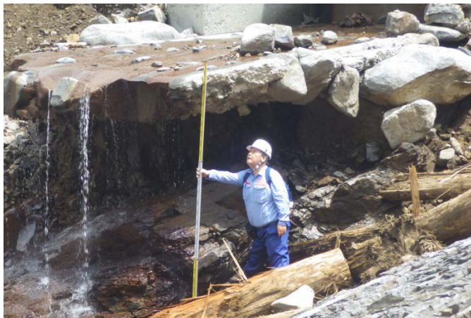
朝倉市そめ谷川被災状況調査（河川調査班）

九州地方の豪雨災害による被災地復旧支援のため、中部地方整備局は、TEC-FORCE（緊急災害対策派遣隊）として、引き続き朝倉市、日田市等の被災状況を調査しています。