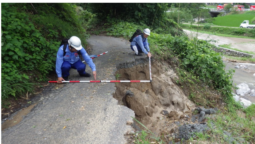
朝倉市杷木大山の市道の現地調査（道路調査班）