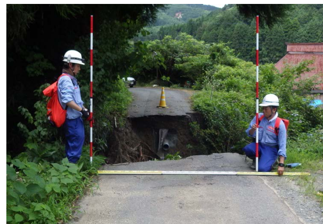
朝倉市黒川地区被災状況調査（道路調査班）