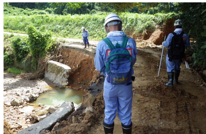
朝倉市須川被災状況調査（道路調査班）