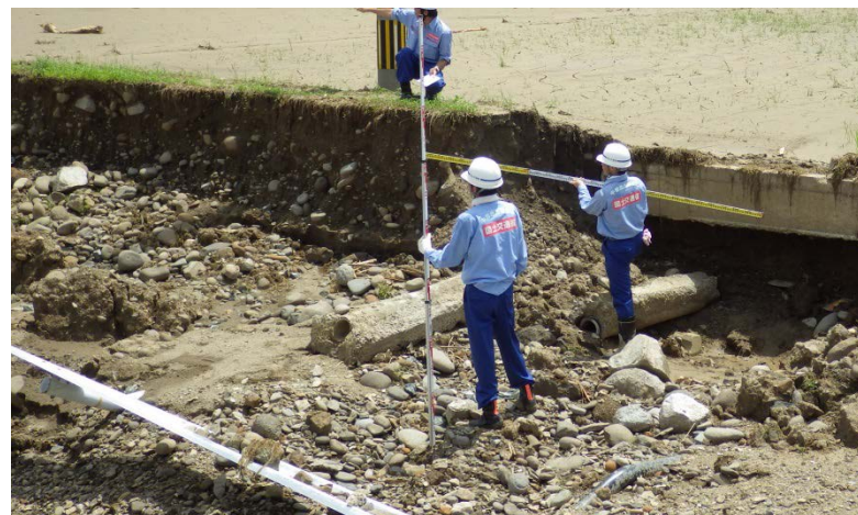
通堂川の現地調査（河川調査班）