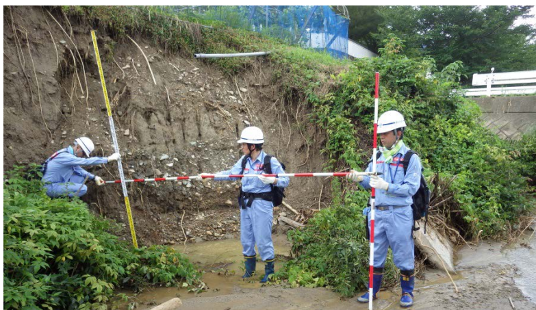
朝倉市杷木志波地区被災状況調査（河川調査班）