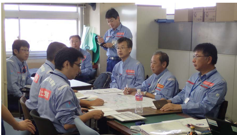
九州地方整備局 TEC-FORCE との打合せ（道路調査班）