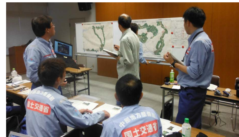
うきは市役所にて道路啓開計画策定打合せ（道路調査班）