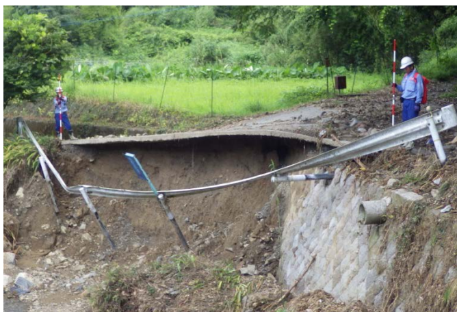
朝倉市黒川地区被災状況調査（道路調査班）