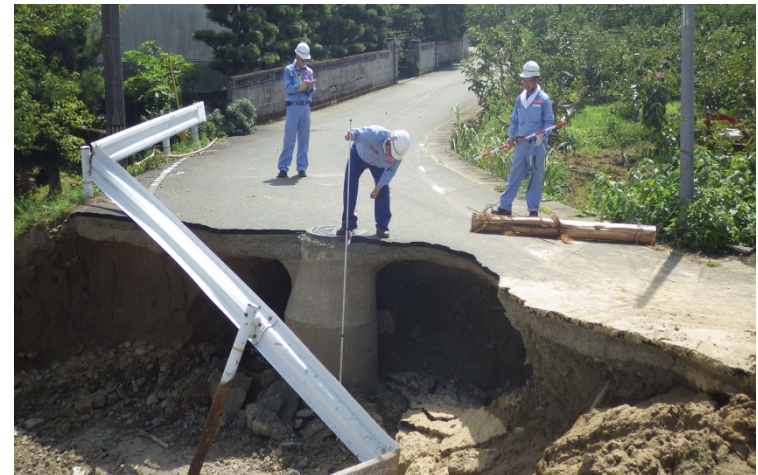
朝倉市宮野の被災状況調査（道路調査班）