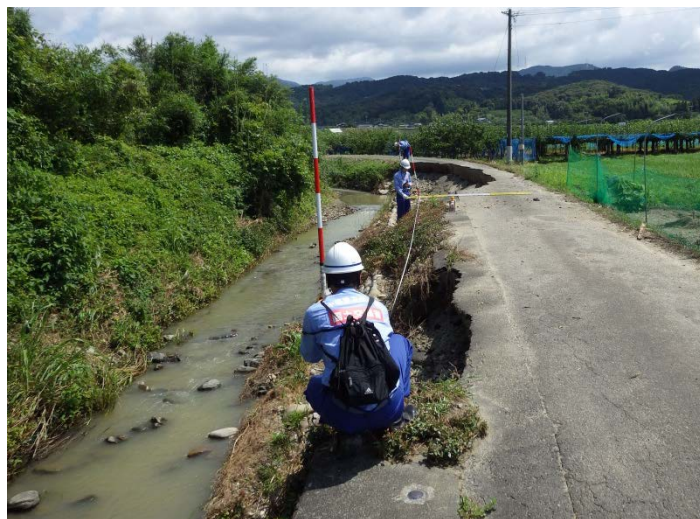
朝倉市屋形原川被災状況調査（河川調査班）

九州地方の豪雨災害による被災地復旧支援のため、中部地方整備局は、TEC-FORCE（緊急災害対策派遣隊）として、福岡県朝倉市、日田市及び添田町内の被災状況を調査しています。