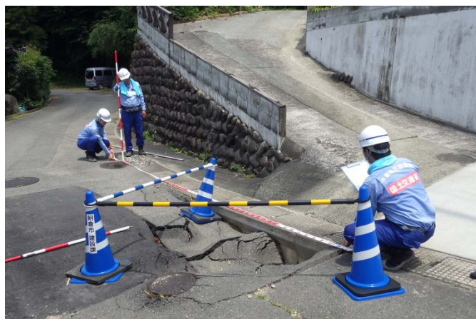
朝倉市菱野地先被災状況調査（道路調査班）