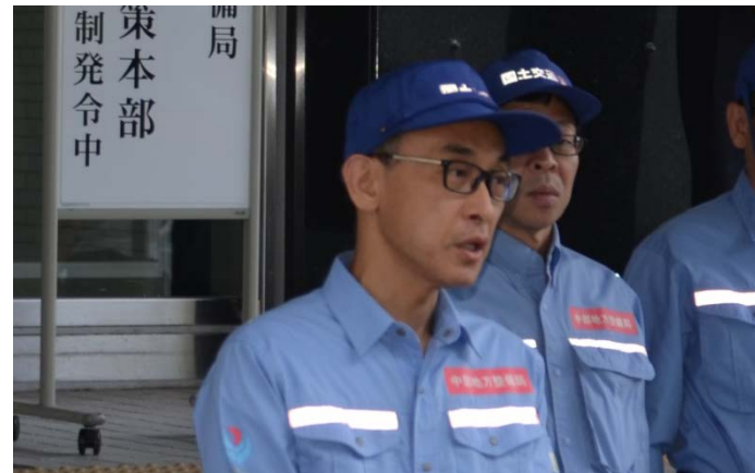
派遣にあたり塚原局長から激励を受ける