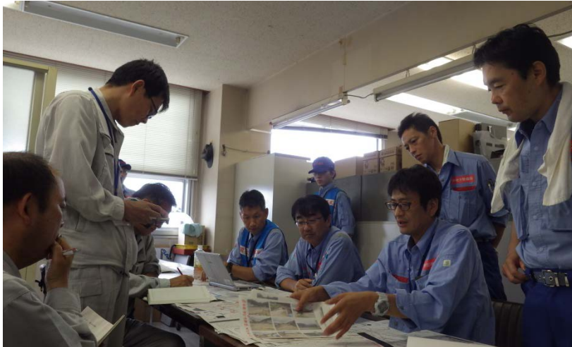
朝倉市役所との打ち合せ