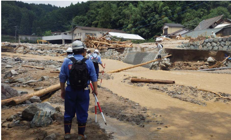
県道52号の現地調査（河川調査班、道路調査班）