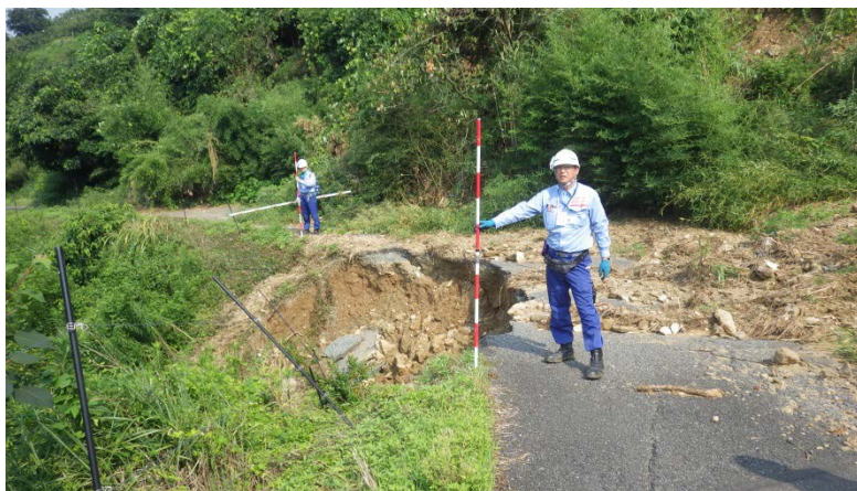
朝倉市須川地区にて被災状況調査（道路調査班）

中部地方整備局 TEC-FORCE（緊急災害対策派遣隊）は、朝倉市の被災状況を調査しました。また、九州地方整備局への活動状況報告とともに、朝倉市役所へ被災状況の調査結果を報告しました。