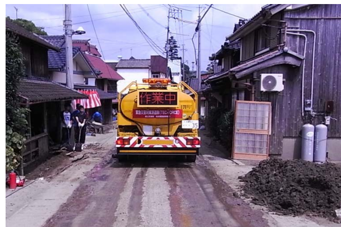
朝倉市比良松地区にて散水作業（応急対策班）