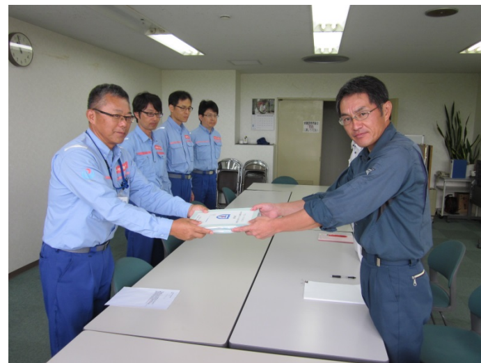
添田町役場にて調査報告書提出（河川調査班）