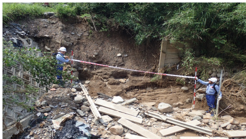
長谷川左岸被災状況調査（河川調査班）