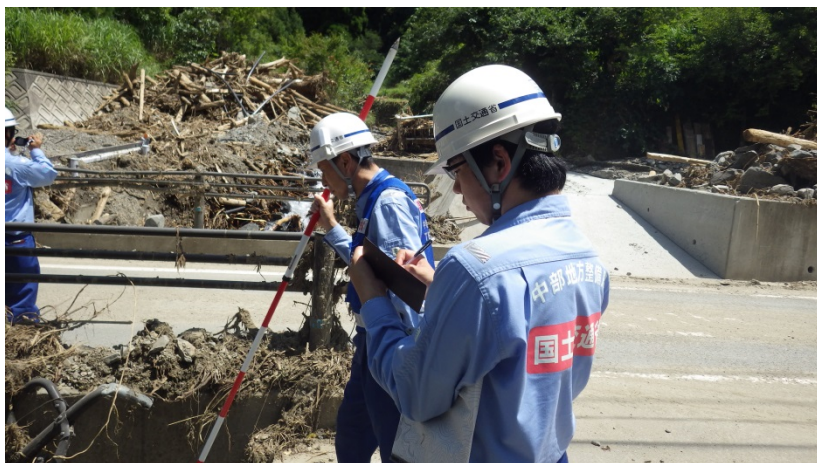
朝倉市田の元川被災状況調査（河川調査班）

九州地方の豪雨災害による被災地復旧支援のため、中部地方整備局は、TEC-FORCE（緊急災害対策派遣隊）として、福岡県朝倉市、日田市及び添田町内の被災状況を調査しています。