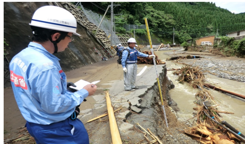
朝倉市藪地区の現地調査（砂防調査班）