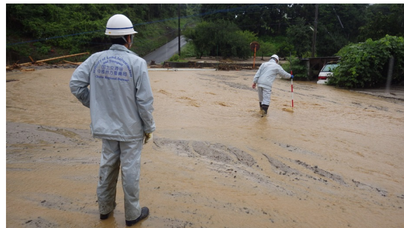
白木谷川の現地調査（河川調査班）