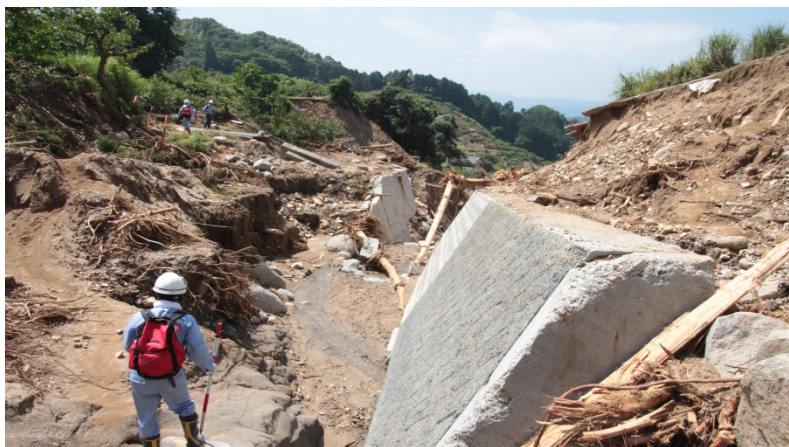
県道588号甘木吉井線被災状況調査（道路調査班）

九州地方の豪雨災害による被災地復旧支援のため、中部地方整備局は、TEC-FORCE（緊急災害対策派遣隊）として、福岡県朝倉市、日田市、うきは市及び添田町内の被災状況を調査しています。