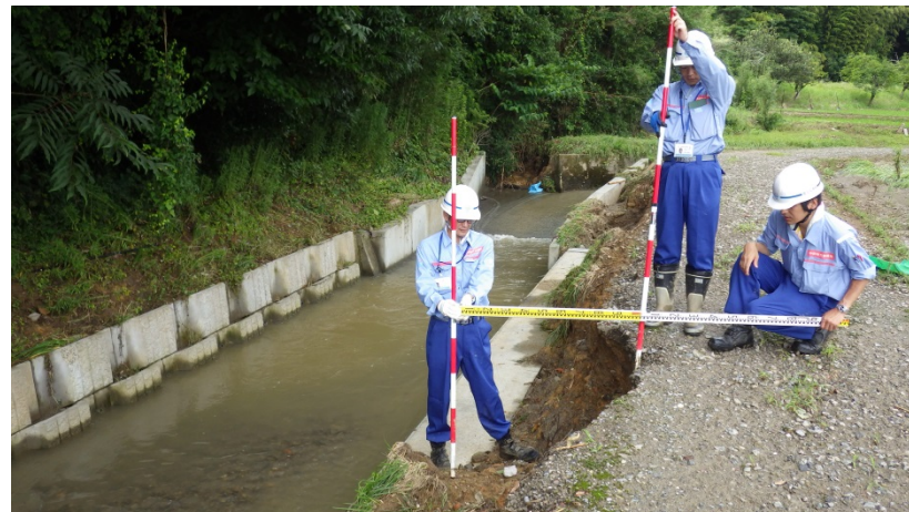
ドウデ川の現地調査②（河川調査班）