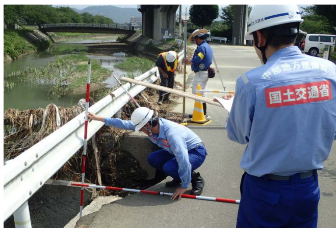
朝倉市荷原川付近の被災状況調査（道路調査班）