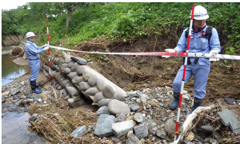
重防川の現地調査（河川調査班）

九州地方の豪雨災害による被災地復旧支援のため、中部地方整備局は、TEC-FORCE（緊急災害対策派遣隊）として、引き続き、福岡県朝倉市周辺の被災状況を調査しています。