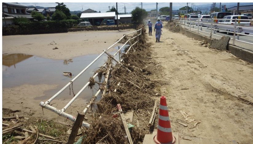
朝倉市道2610号線被災状況調査（道路調査班）