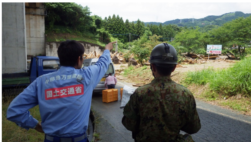
自衛隊と共に（河川調査班）

九州地方の豪雨災害による被災地復旧支援のため、中部地方整備局 TEC-FORCE 隊（緊急災害対策派遣隊）は、引き続き、福岡県朝倉市周辺の被災状況を調査しています。