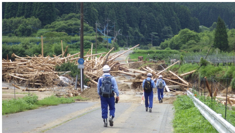
朝倉市黒川右岸被災状況調査（河川調査班）

九州地方の豪雨災害による被災地復旧支援のため、中部地方整備局は、TEC-FORCE（緊急災害対策派遣隊）として、福岡県朝倉市、日田市、うきは市及び添田町内の被災状況を調査しています。