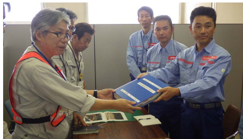
朝倉市都市建設部長へ調査結果を報告 （河川調査班、砂防調査班）