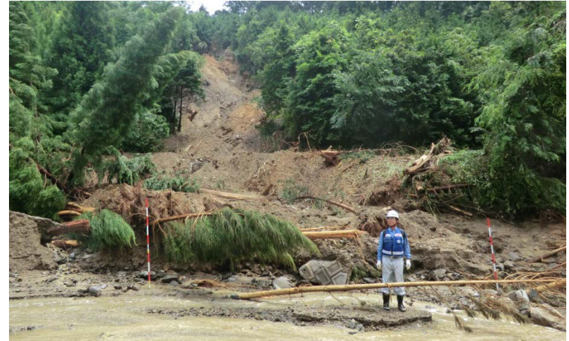
朝倉市 奈良ヶ谷川の現地調査（砂防調査班）