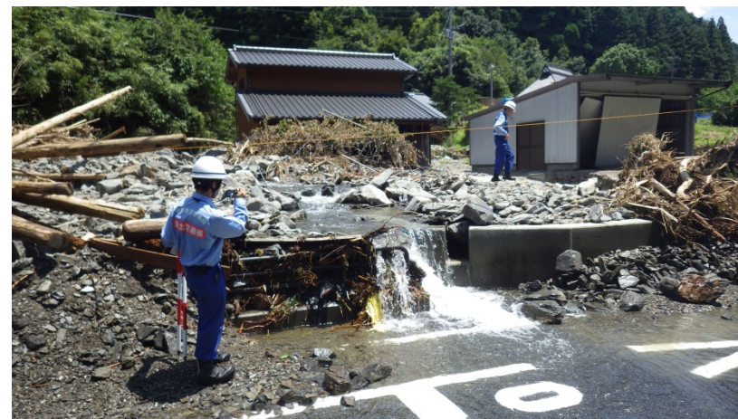
朝倉市中村川被災状況調査（河川調査班）