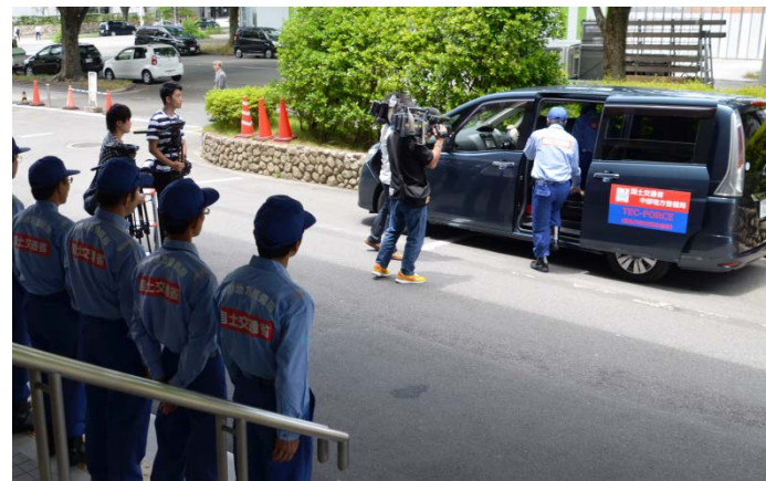
現地へ出発する隊員