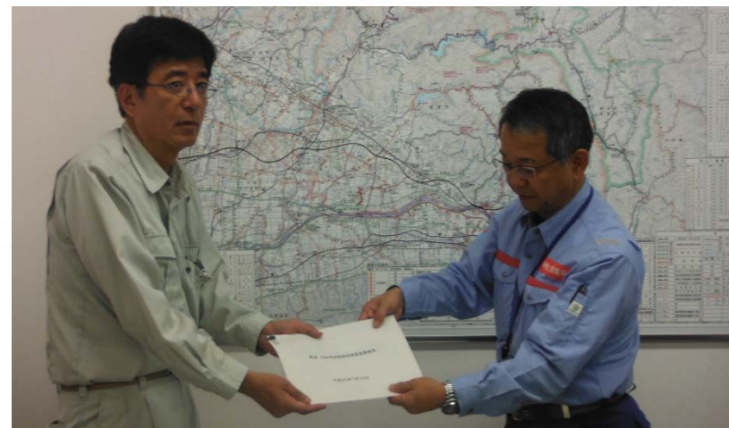
朝倉県土整備事務所長に県道588号線の被災状況報告（道路調査班）