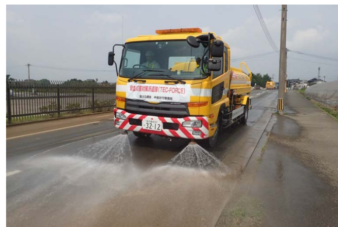
朝倉市石成・比良松地区にて散水作業（応急対策班）