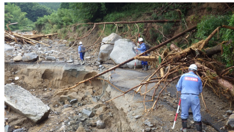
朝倉市杷木古賀地区被災状況調査（砂防調査班）