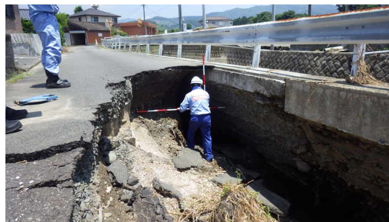
朝倉市入地市道被災状況調査（道路調査班）