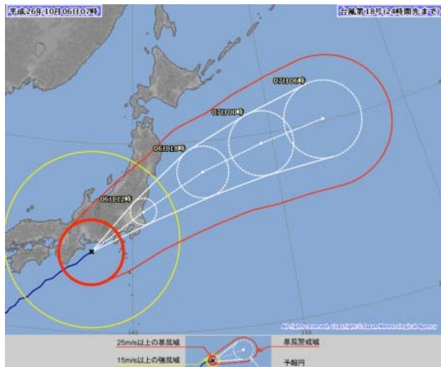
台風 18 号経路図 (10 月 6 日 7 時現在)