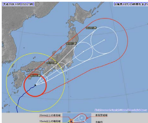
台風 18 号経路図 (10 月 5 日 23 時現在)