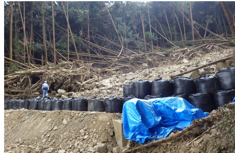
応急復旧対策の実施状況