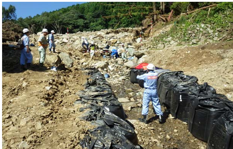
大型土のう設置の監督状況

大型土のう設置について施工監督を行いました。また、今後の作業について施工業者と打合せを行うとともに、地元関係者への説明を行いました。