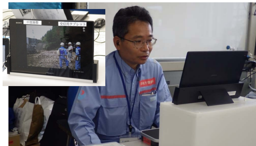
タブレット端末を利用した現地と災害対策本部との会議の様子