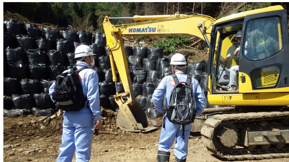
土のう設置状況の確認