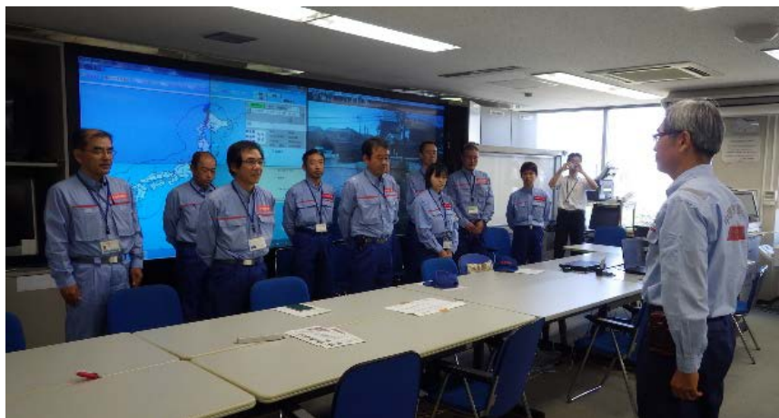
中国地方整備局長への報告