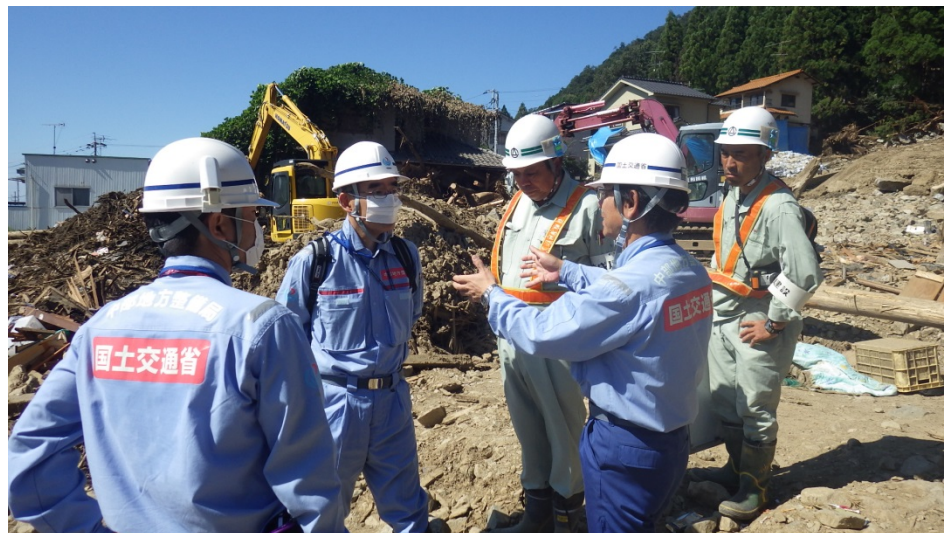
作業内容の施工業者との打ち合わせ（越美・木曾上班）

昨日に引き続き、応急復旧箇所（大型土のう設置箇所）の施工監督を行いました。また、本日は休日ということもあり、多くのボランティアの方々が熱心に活動してみえました。