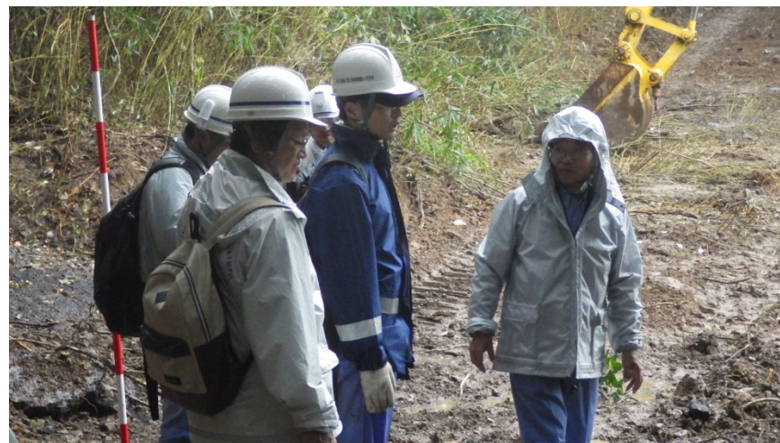
国総研と応急復旧工法について現地確認を実施