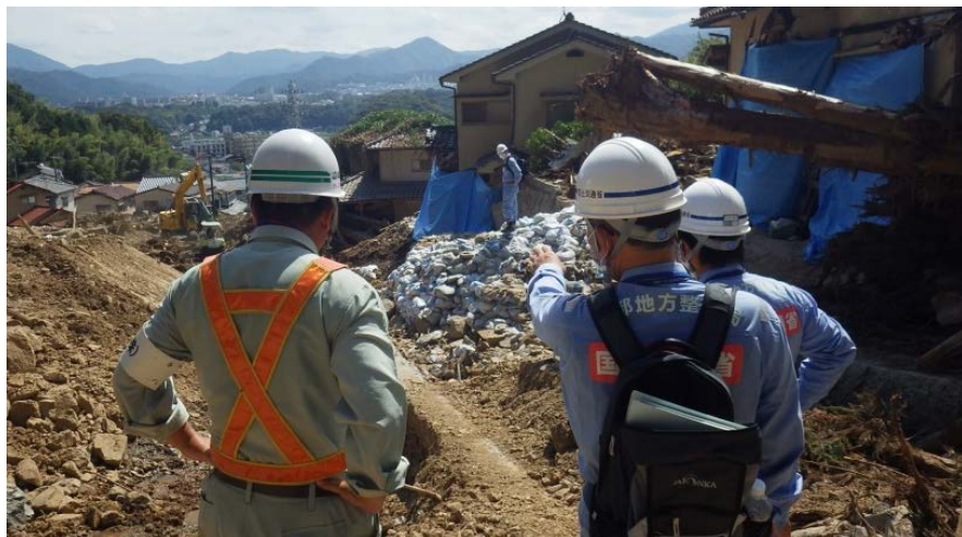
現場確認後、土砂撤去箇所を地元建設会社の担当者へ指示

昨日に引き続き、応急復旧工事の現場確認を行い、作業を行う地元建設会社の担当者へ指示を行いました。また、国土技術政策総合研究所、中国地方整備局、広島市担当者と現場打ち合わせを行い、引継ぎ資料の作成を行いました。