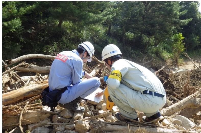
第4陣TEC-FORCE隊員と施工業者との打合せ