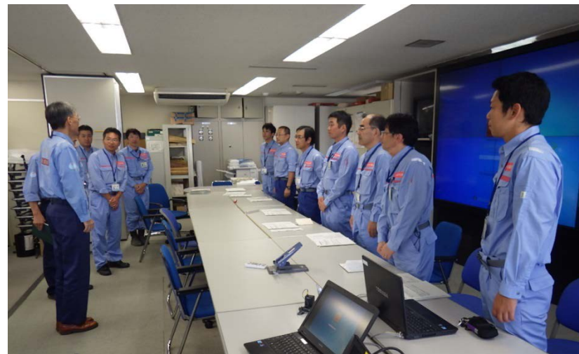
第3陣から第4陣への引き継ぎ