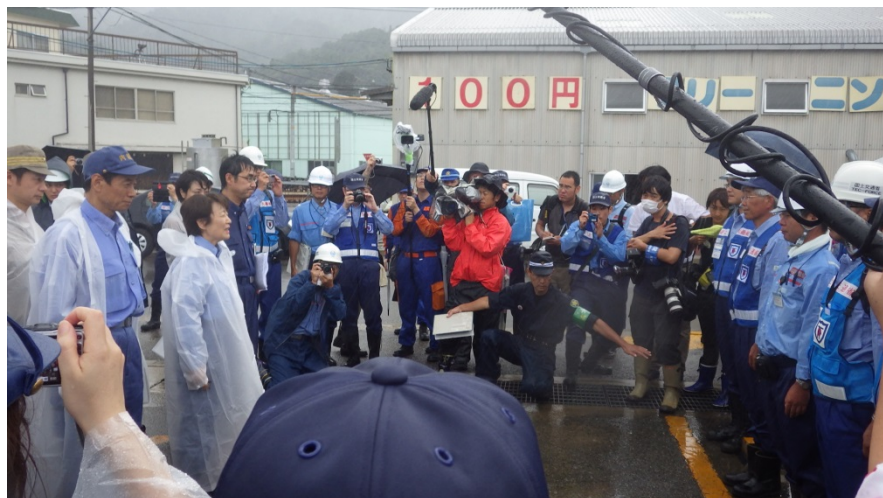
山谷防災担当大臣によるTEC-FORCE隊員への激励

山谷防災担当大臣に「皆さんよくやっていたいている」と激励をうけた。また、天上班現場において応急復旧工法について国総研に技術的指導を仰いだ。