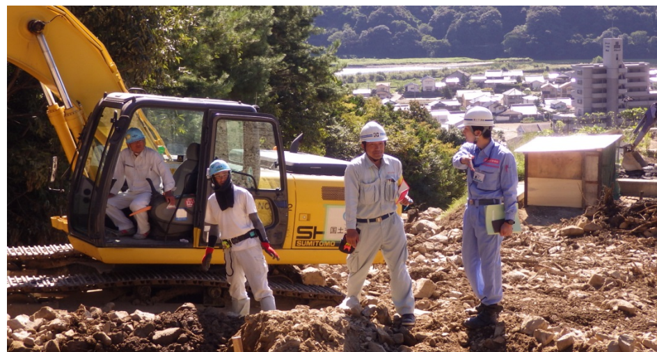
作業内容の施工業者との打ち合わせ（木曾下班）