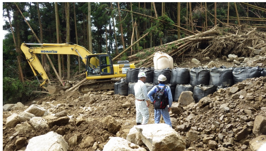
大型土のうの設置について地元施行業者と打ち合わせ