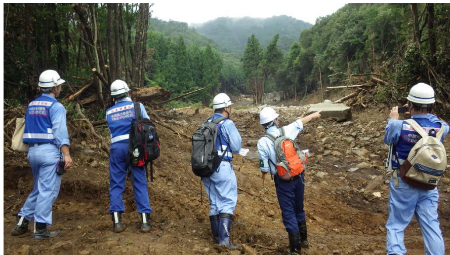
大型土のう設置予定箇所の確認