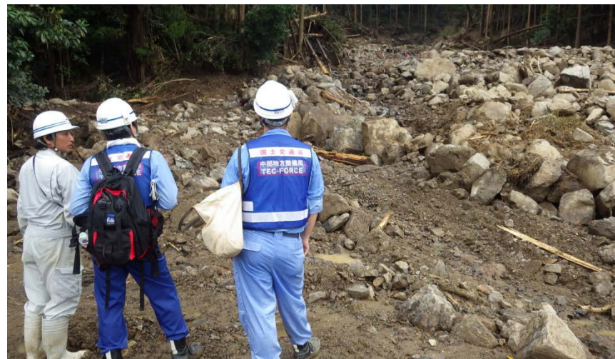
大型土のう設置予定箇所の確認