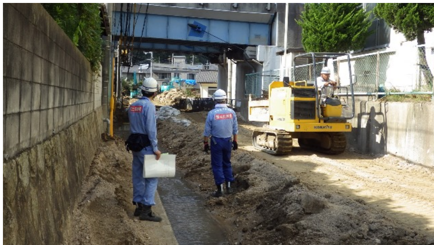
施工現場下流の排水路を調査