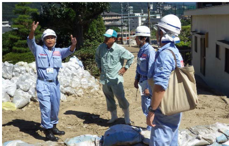
地元関係者へ施工状況を説明