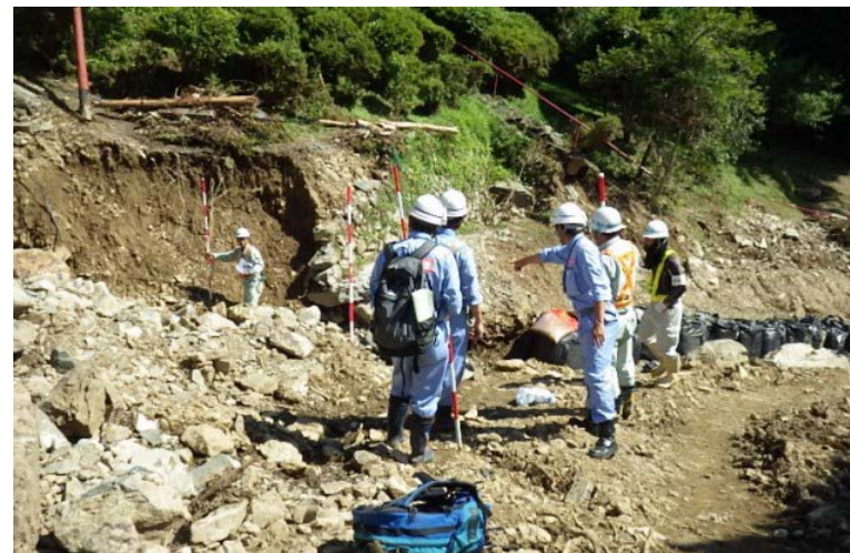
大型土のう設置の監督状況