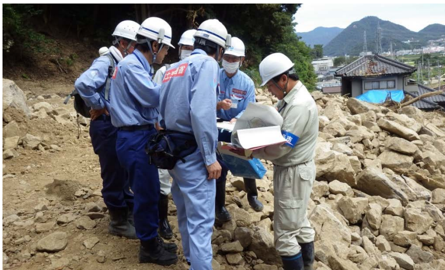
広島市と引き継ぎについて打ち合わせ

応急復旧箇所(大型土のう設置箇所)の引き継ぎについて広島市と打ち合わせを行いました。 また、中部地方整備局作業箇所において、中国地方整備局長が状況確認を行いました。