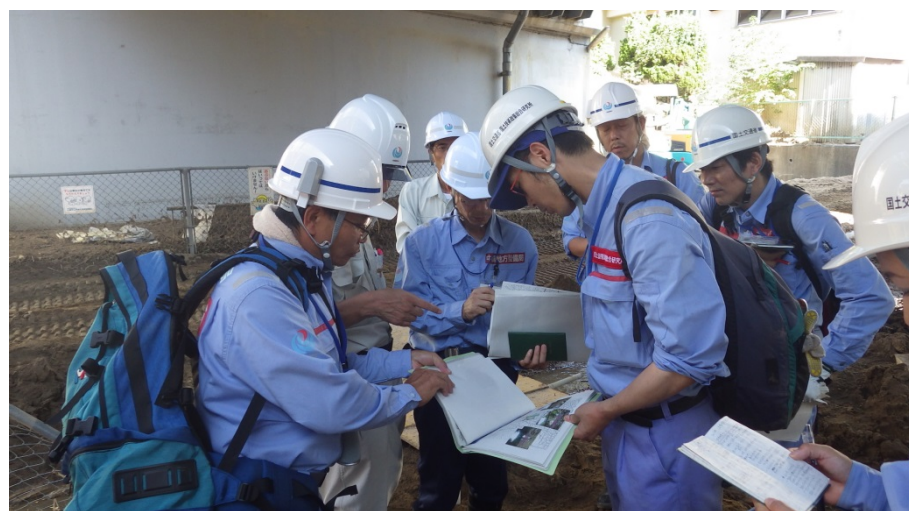
国総研と応急復旧工法について打ち合わせ