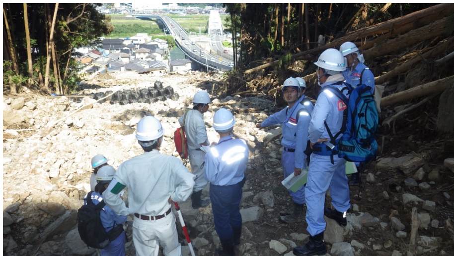
国総研から応急復旧工法についての技術的指導