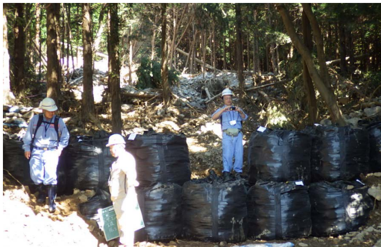
大型土のう設置作業指示

第3陣は午前中に大型土のう設置の施工監督を行いました。第4陣として派遣されたTEC-FORCE隊員は本日午後に中国地方整備局に到着し、その後第3陣と第4陣で現地確認を実施しました。