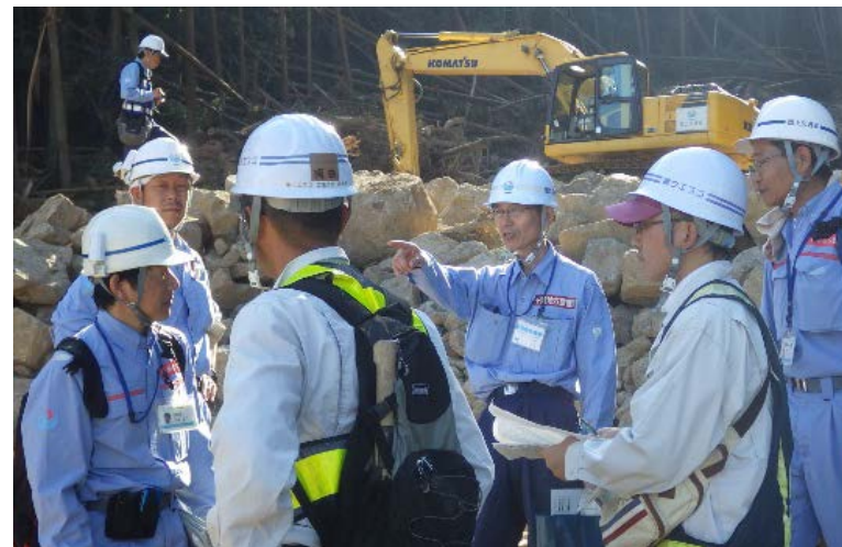
施工業者と打合せ