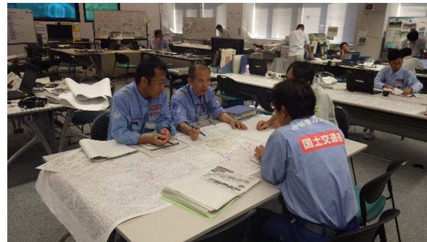
作業状況等について中国地方整備局と打合せ