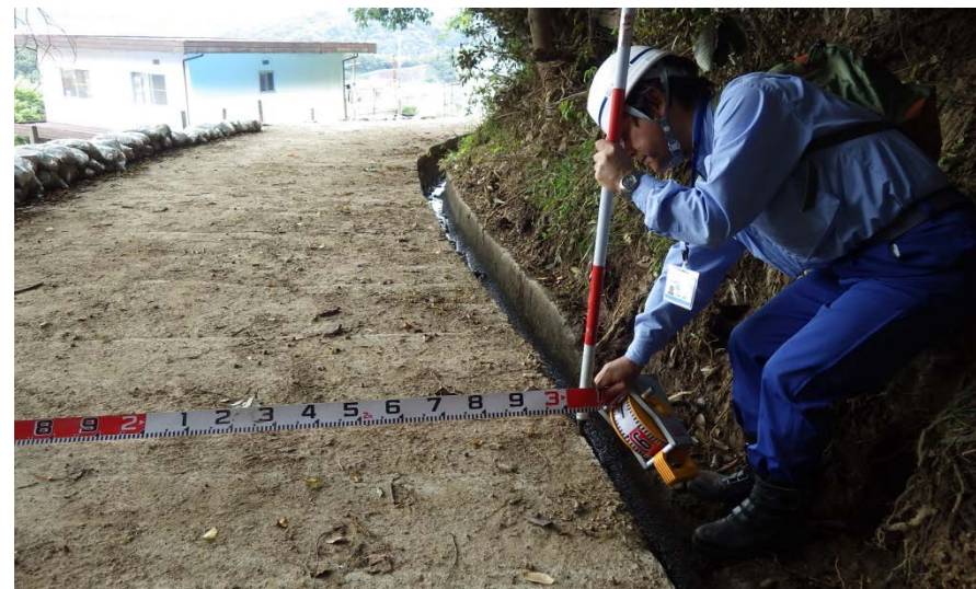
施工現場下流の排水路を調査