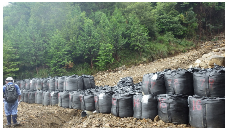
大型土のうの設置状況