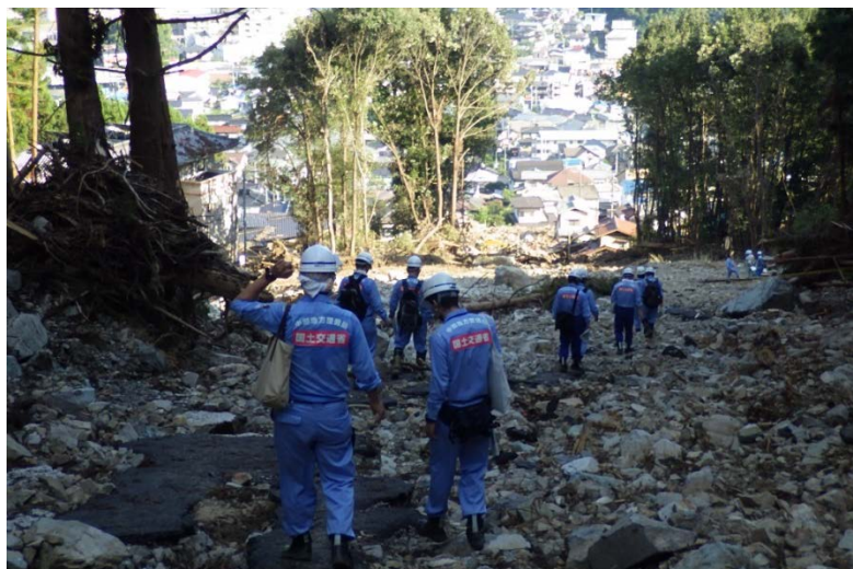
第3陣、第4陣との現地確認