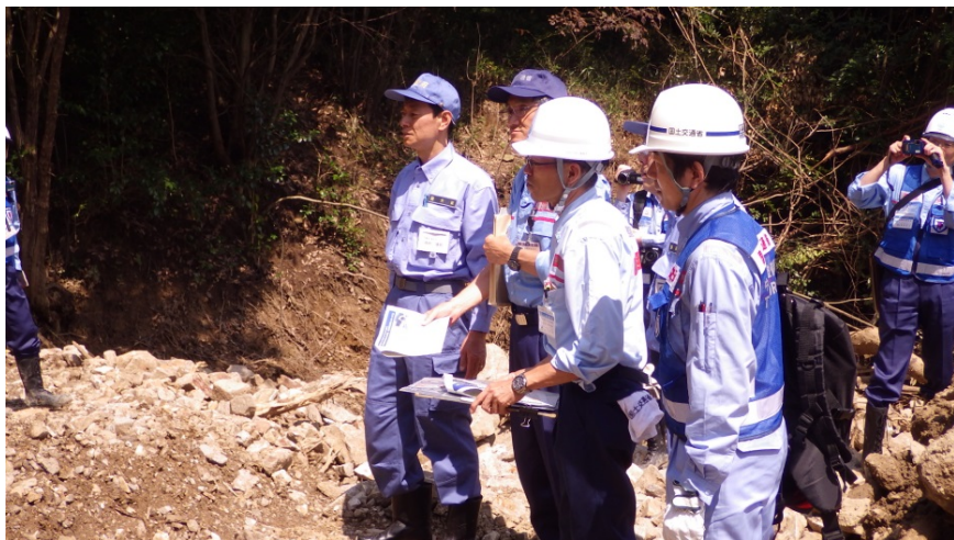
内閣府西村副大臣による現場の視察状況