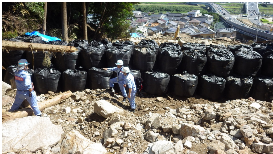
大型土のう設置状況の確認

昨日までに設置した大型土のう設置状況の確認を行うとともに、応急復旧工法について国総研に技術的指導を仰ぎました。また、今後作業を行う箇所について、設置場所の検討を行いました。