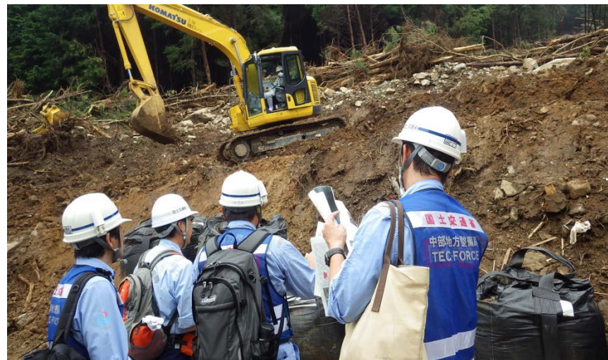
作業の進捗状況の確認