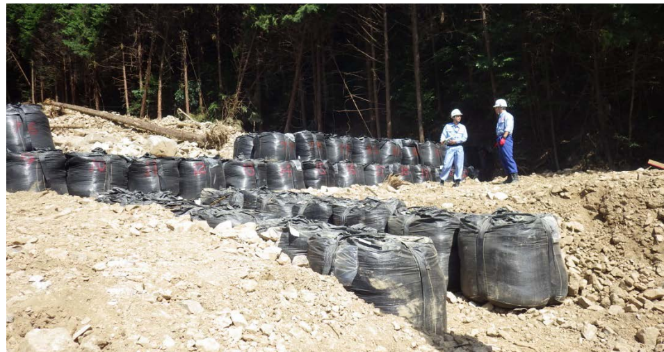
大型土のう設置完了確認