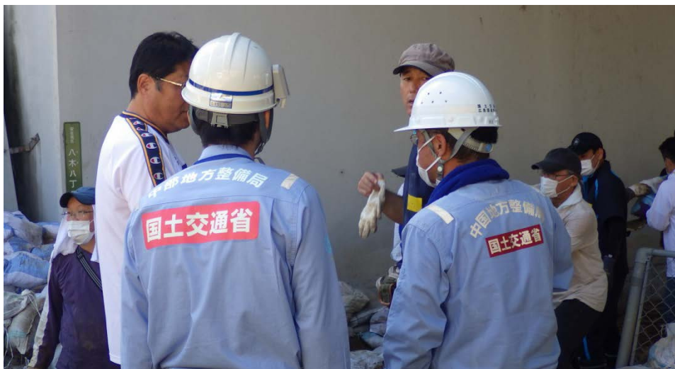
ボランティアの方々の要望を伺う