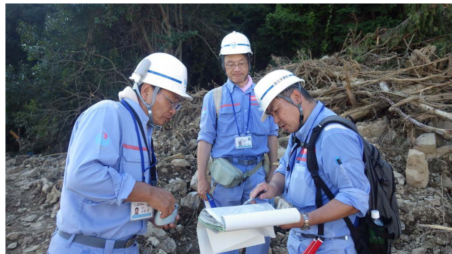
大型土のう設置場所の検討