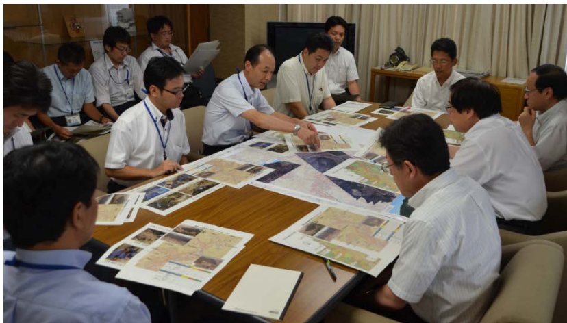
第2陣のTEC-FORCE隊員からの報告状況