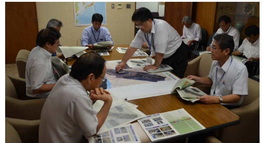
第1陣のTEC-FORCE隊員からの報告状況(8月29日)