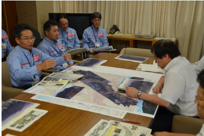
局長へ帰還報告を行う第3陣派遣メンバー

9月3日から現地で活動していた第3陣が本日午後帰還し、中部地方整備局長に帰還報告を行いました。また、第4陣のTEC-FORCE隊員は、第3陣に引き続き応急復旧対策の施工監督を行いました。