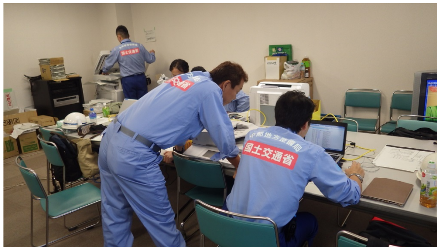
作業着手前の打ち合わせ

昨日から新たに応急対策班として派遣されたTEC-FORCE隊員(第3陣7名)は、二次災害防止のため大型土のう設置等の対策を始めるにあたり、現地状況の確認を行いました。