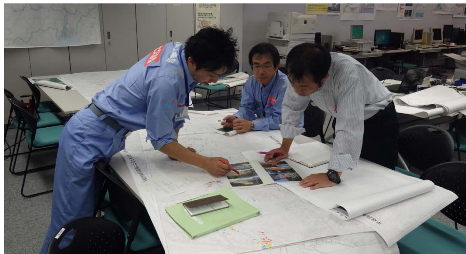
中国地方整備局と作業状況について打ち合わせ