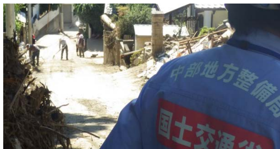
ボランティアの方々も熱心に活動