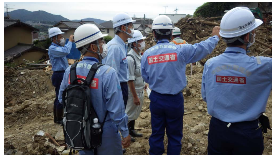
作業状況について中国地方整備局長に説明