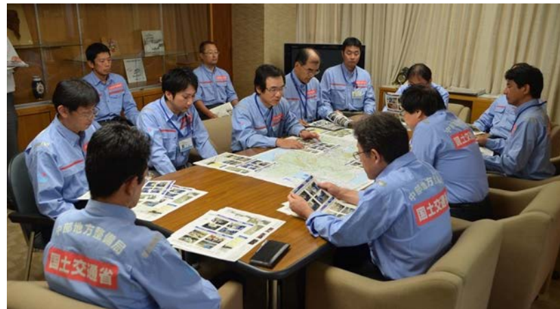
中部地方整備局長への帰還報告