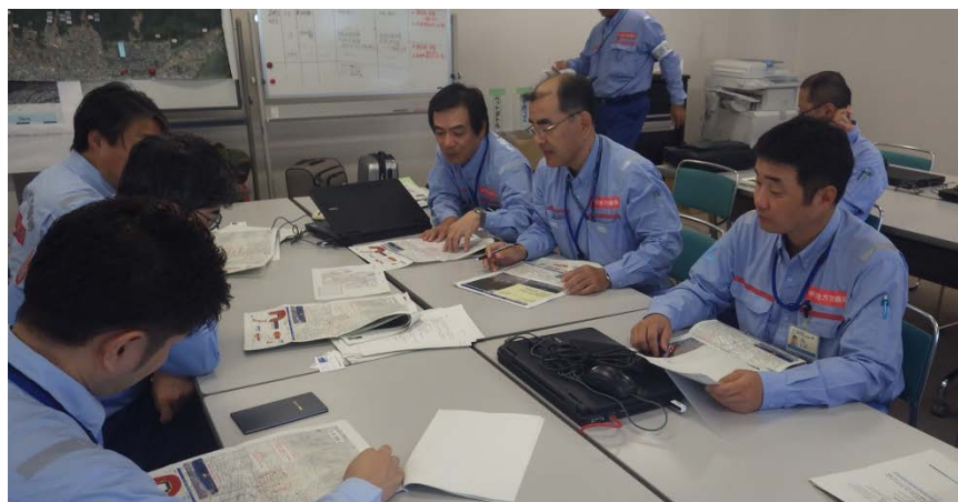
中国地方整備局への引継ぎ