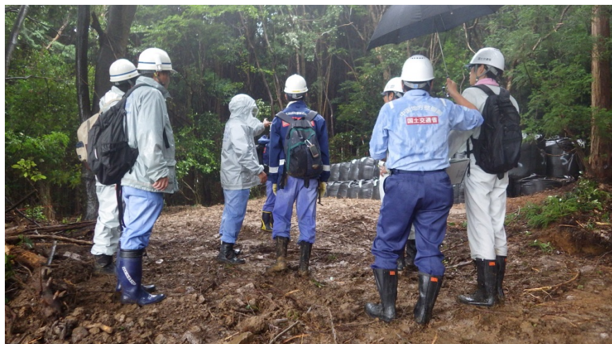
国総研と応急復旧工法について現地確認を実施