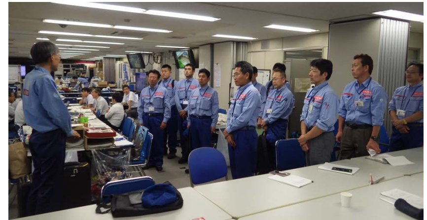
明日からの活動に向けた打ち合わせ