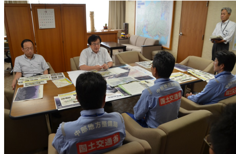
局長へ帰還報告を行う第3陣派遣メンバー