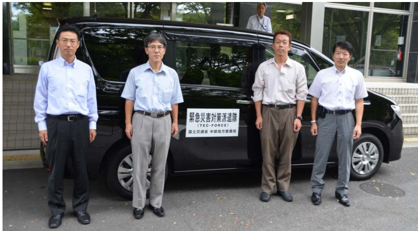
第3陣として派遣されるTEC-FORCE隊員

第3陣として派遣されるTEC-FORCE隊員は本日夕方に中国地方整備局に到着しました。第1陣、第2陣のTEC-FORCE隊員がとりまとめた現地調査結果を基に、応急復旧対策に重点を置いた活動を明日から開始する予定です。また、第2陣のTEC-FORCE隊員は、中部地方整備局長に対して活動報告を行いました。