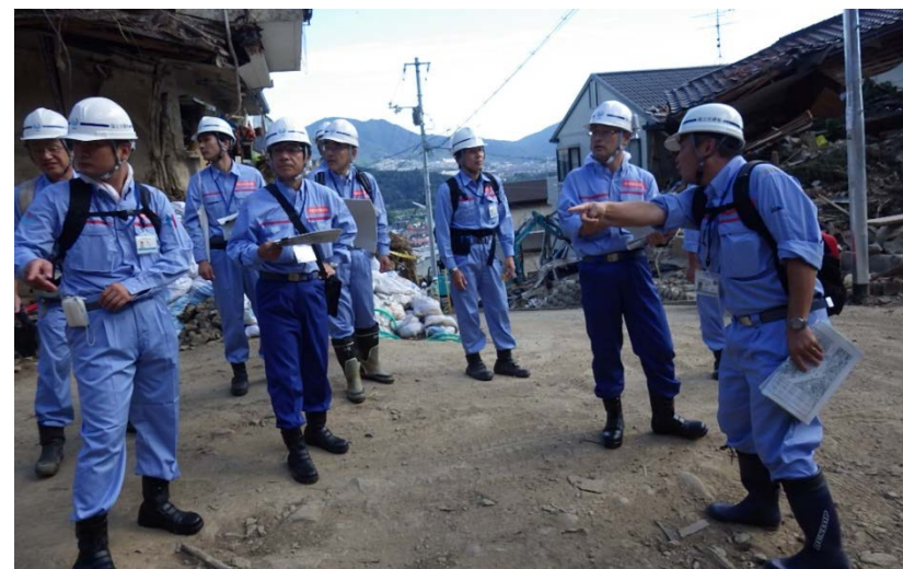
第3陣、第4陣との現地確認