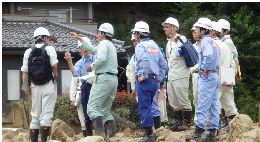
国土技術政策総合研究所・中国地方整備局・広島市と現場打ち合わせ