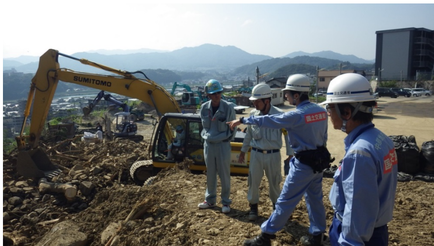
施工業者と打合せ

大型土のう設置作業の施工監督及び施工現場下流の排水路調査を行いました。また、作業状況等について中国地方整備局と打合せを行いました。