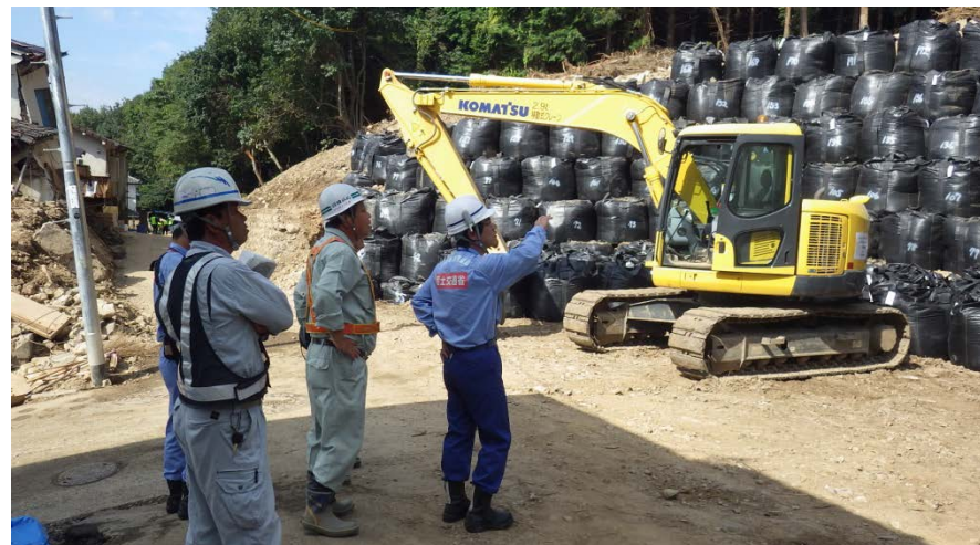
地元建設会社の担当者へ土のう設置箇所を指示