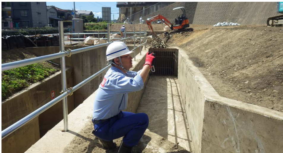
土のう設置箇所下流の現場確認

応急復旧工事の現場確認を行い、中国地方整備局と打ち合わせを実施しました。また、現場ではボランティアの方々からの要望に対応しました。