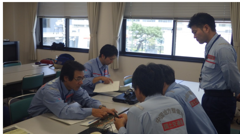
中国地方整備局への引継ぎ