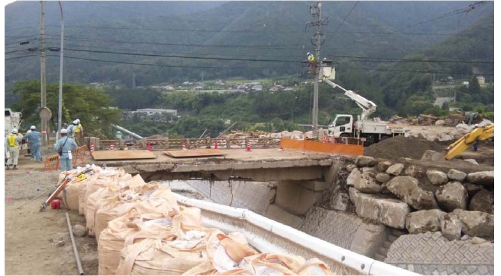
②架設準備状況(7月12日 PM撮影)