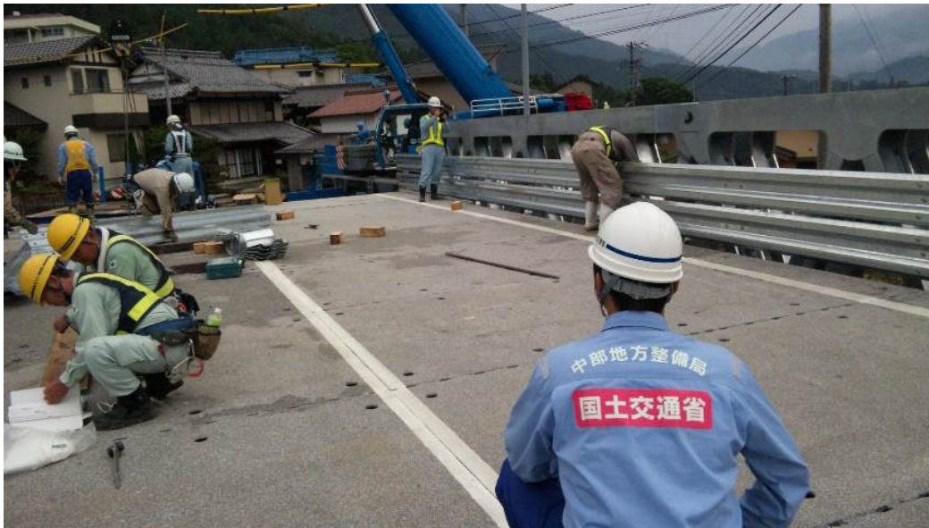
⑦ガードレール取付状況(7月14日 16:30撮影)