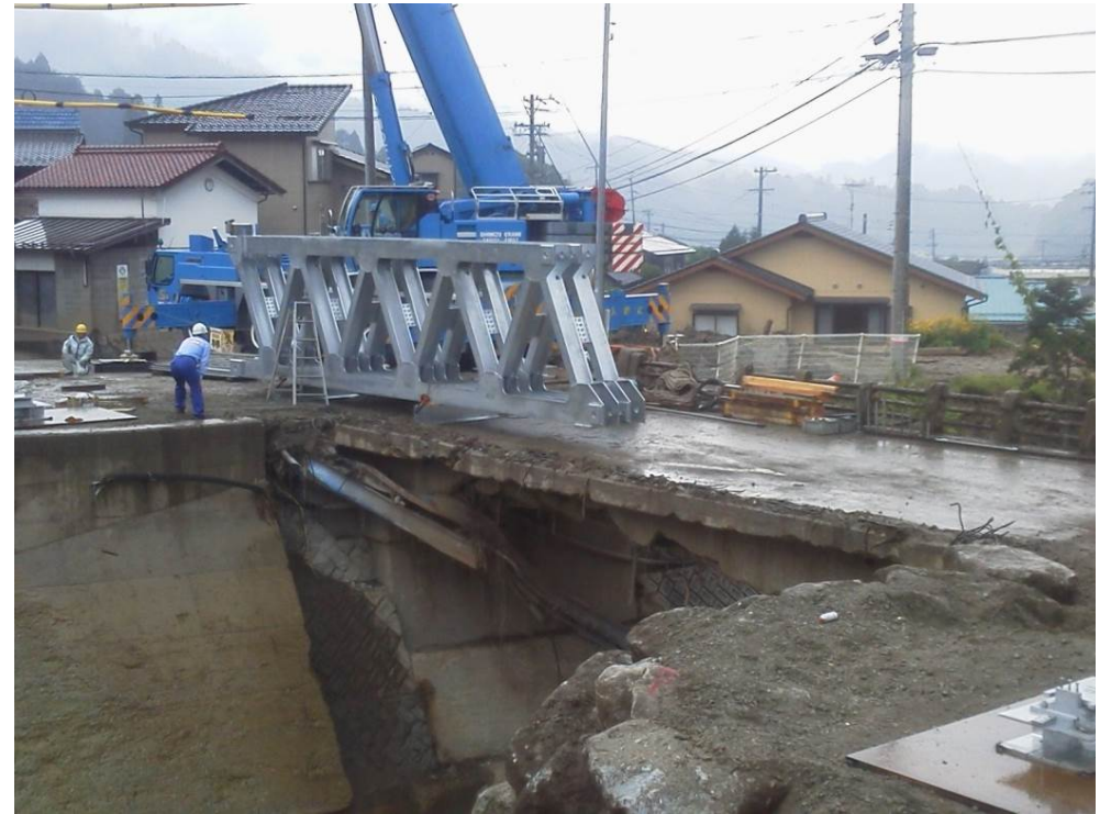
④トラス主桁組立状況(7月13日 15:00撮影)