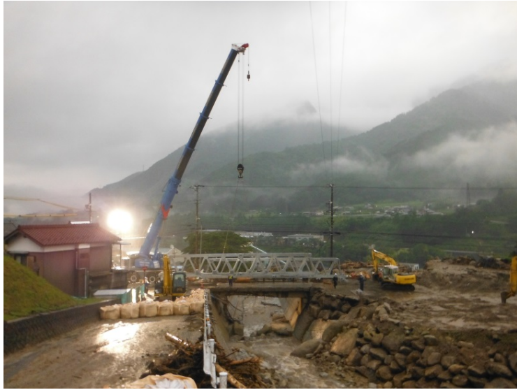
⑤トラス桁架設状況(7月13日 18:00撮影)