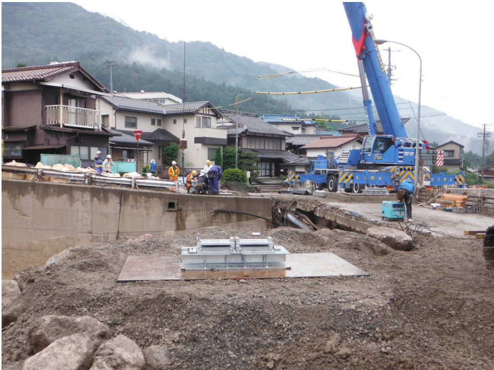
③基礎(支承台座及び沓)設置(7月13日 14:30撮影)