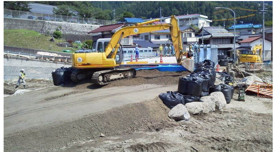
⑧仮橋取付部施工状況(7月15日 14:00撮影)