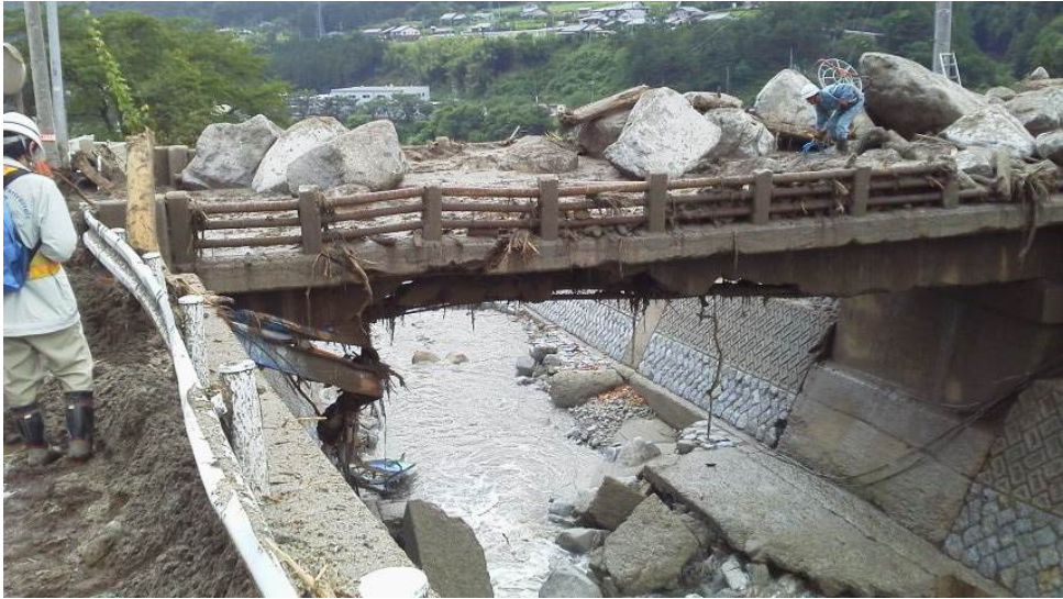
①被災直後(7月11日 AM撮影)