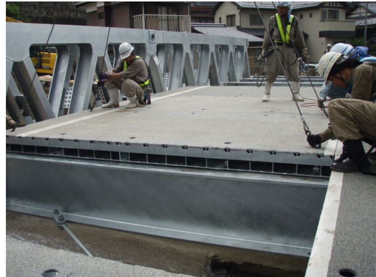
⑥横桁・横構取付、覆工板据付状況(7月14日 15:00撮影)