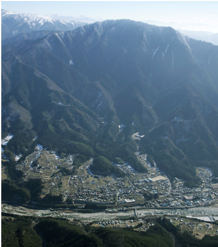
【被災前(梨子沢全景):H17撮影】