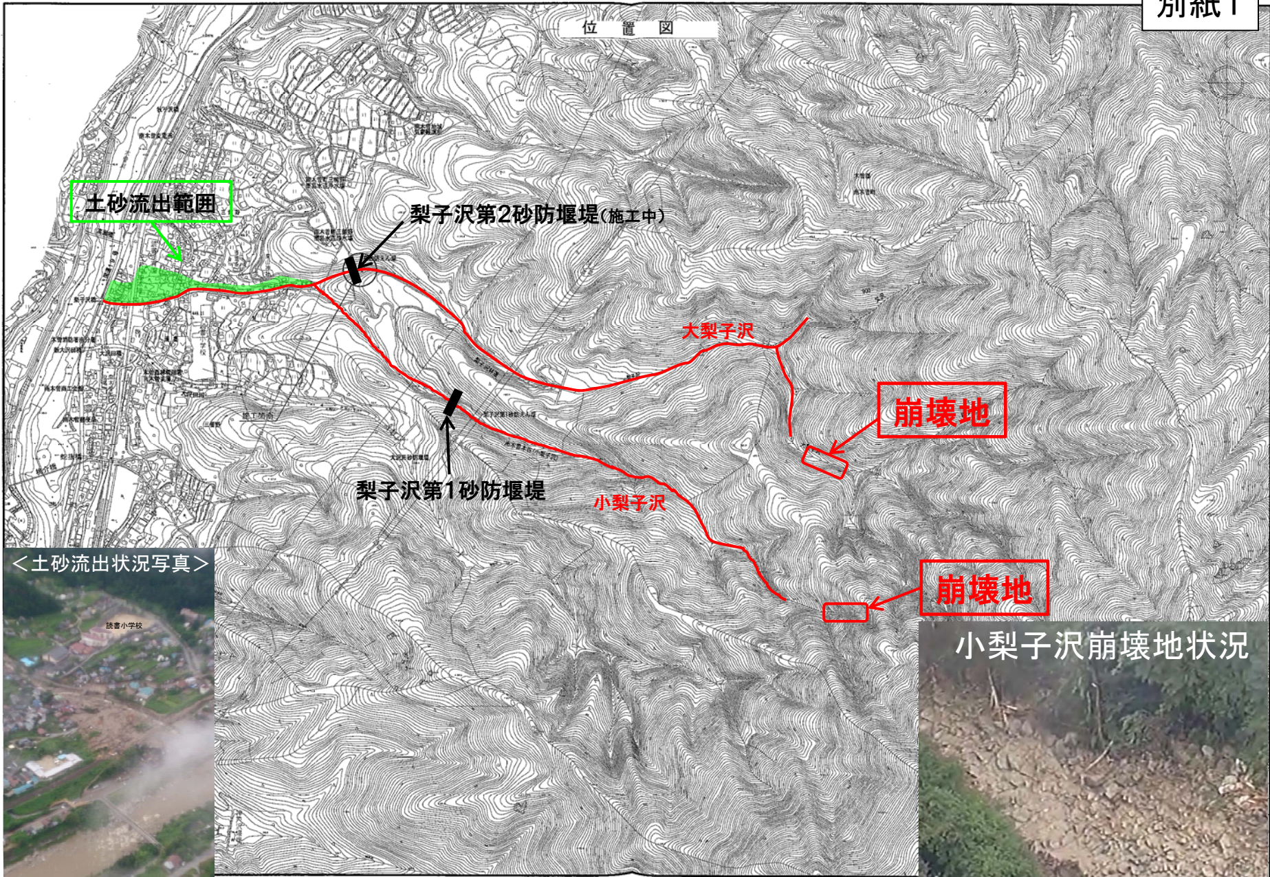
<土砂流出状況写真>