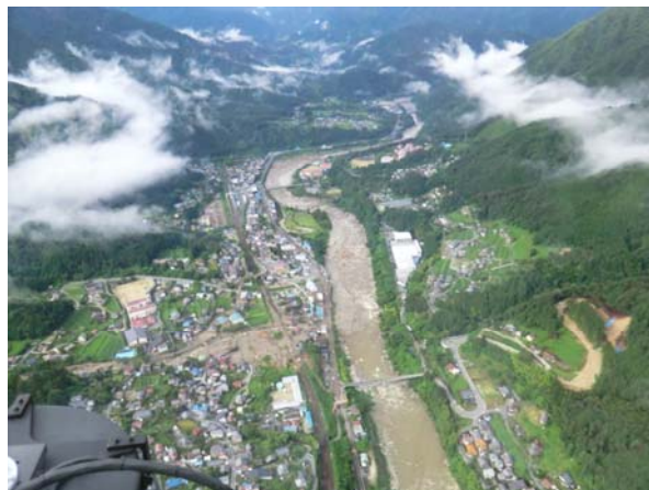
国土交通省 梨子沢へり画像