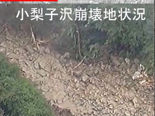
小梨子沢崩壊地状況