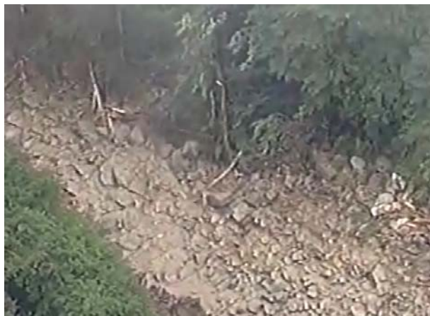
崩壊状況（小梨子沢）

また、さらなる被害の拡大を防ぐため、被災箇所において 13:30 より緊急的な応急復旧工事に着手しました。（別紙 2）