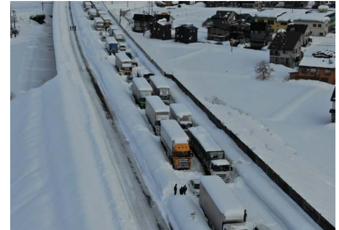
関越自動車道の立ち往生発生状況 令和2年12月18日(金)