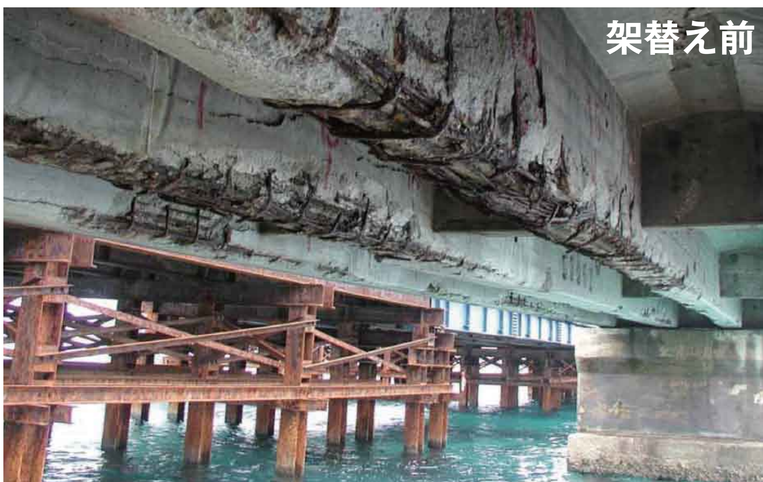
中の鋼材が腐食し、コンクリートが剥がれ落ちたところ