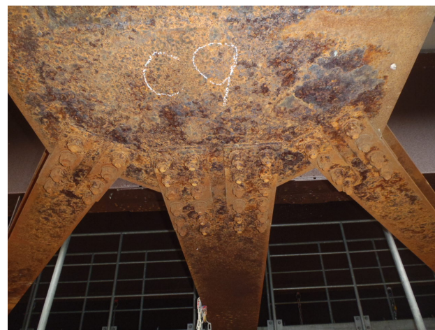
横桁、下横構の腐食