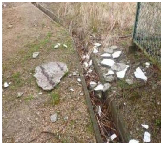
剥落したコンクリート片