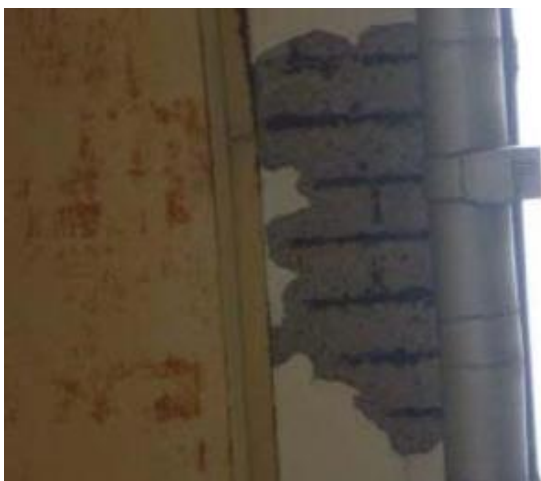
RC床版張り出し部の剥落箇所