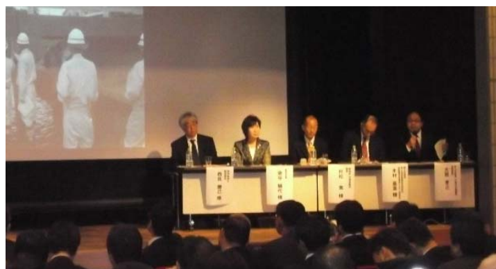
【ディスカッション風景】