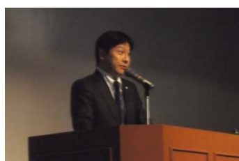
【あいさつ】 田辺静岡市長