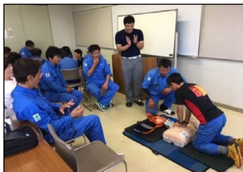
取組②教育研修の状況