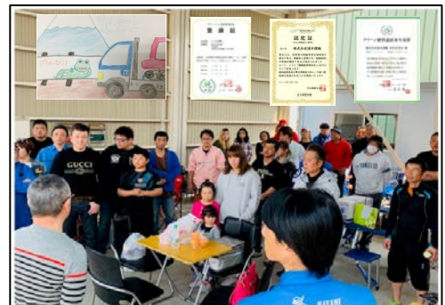
取組④コミュニケーション状況