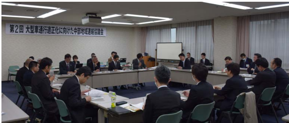
第2回連絡協議会の開催状況

※ 「大型車通行適正化に向けた中部地域連絡協議会」では、関係企業団体5団体、警察本部3団体、中部運輸局、道路管理者7団体の合計19団体がパートナーとなり、広報活動を中心とした検討と取り組みを継続的に展開していきます。