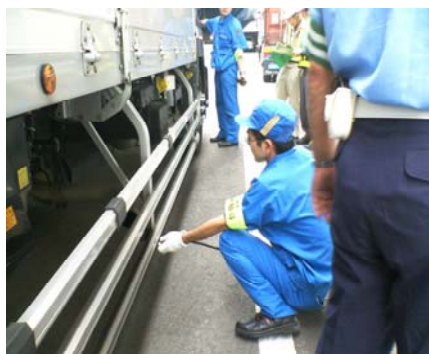
黒煙を対象とした街頭検査

②黒煙の排出量の規制値違反が認められた時や③不正軽油の使用が認められた時は、警告又は整備命令等の措置を行います。