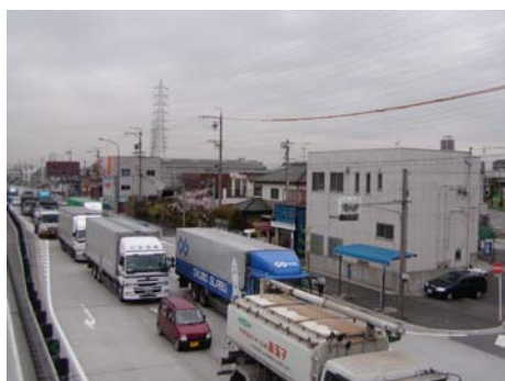
国道23号（港区宝神）の交通状況

ハイブリッド自動車や天然ガス自動車などの低公害車は、環境への負荷が少ない自動車です