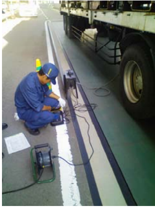
ディーゼル車黒煙・不正軽油街頭検査状況