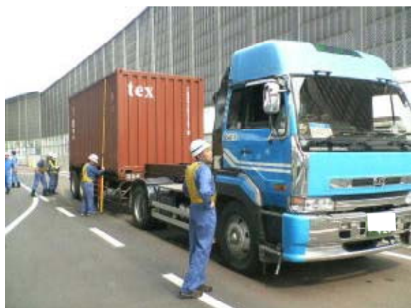
特殊車両確認状況

道路構造の保全、交通の危険防止、沿道環境の改善などの道路利用の適正化を図るため、取り締まりを行い、違反内容に応じて、措置命令や指導警告などの措置を行います。