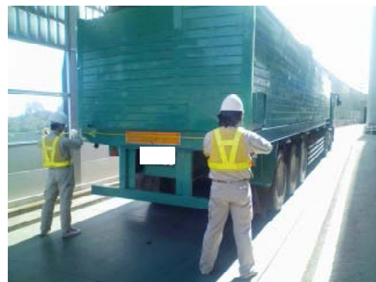
特殊車両確認状況