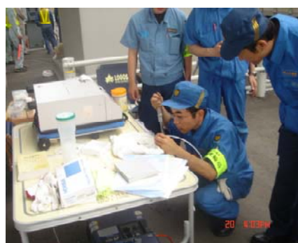
不正軽油を対象とした街頭検査