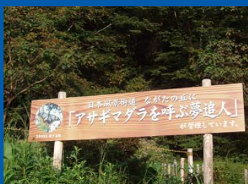
⑧ アサギマダラ飛来箇所の看板