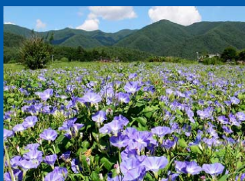
⑥ ヘブンリーブルー(8月)