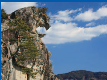
ししいわ 4 世界遺産 獅子岩