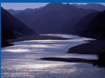
くまのかわ 6 世界遺産 熊野川