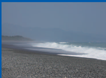
しちりみはま 5 世界遺産 七里御浜