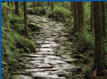
まごせとうげ 2 世界遺産 馬越峠