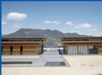
3 三重県立熊野古道センター