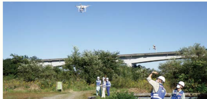
被災状況調査研修

災害時にテックフォースとして派遣される可能性のある職員に、被災状況調査、応急対策の実動業務訓練等の実務を通じ、TEC活動の幅広い知識・技能を修得し、実行力のあるTEC-FORCE隊員を養成します。