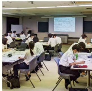
グループ意見交換・発表