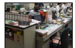
■企画課受付 企画課受付にて、「個別業務説明会に来ました」とお伝えください。