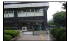
①入口 名古屋合同庁舎2号館東側入口よりお入りください。

1階東側入口付近の守衛室で入館手続きを行っていただき、6階企画課受付へ予約時刻の10分前にお越しください。