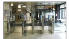
③ゲート ゲート通過には、入館受付で発行するカード(赤色)が必要です。