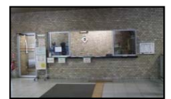
②入館手続き 「来庁者受付名簿」に氏名等を記載してください。身分証明書が必要です。