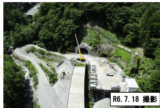
トンネル坑口(長野県側)