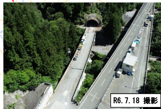
トンネル坑口(静岡県側)