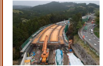
【三島側から箱根側を望む】

お世話になっております。 先月は2回コンクリートの打設を行いまして、現在3回目のコンクリート打設に向けて進めております。 5月の中旬頃に3回目のコンクリート打設を予定しております。橋体部分が完成いたします。 コンクリート打設の際に生コン車の搬入を行うときには早めの合図を徹底し、交通誘導員の合図に従い一般車両及び歩行者を優先し作業を行ってまいります。引き続きご理解とご協力をお願い致します。