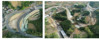
【大曲切廻し完了】 【起点側から終点側 全景】

お世話になっております。 皆様のご協力により、国道1号大曲を4月23日に切り回すことが出来たこと感謝いたします。 近隣住民の皆様には交通規制等でご迷惑をお掛け致しました。 工事の方は、本線の掘削から盛土、搬出を行い、法面工では鉄筋挿入を行います。擁壁工では地盤改良を行った後現場打ち擁壁を構築します。各種排水構造物も施工する予定です。 3号函渠回りの工事にも着手し残土を搬出いたします。工事用車両の通行や資機材の搬入等で多くありますが、安全第一、地元優先で作業をすすめますので、ご理解とご協力をお願い致します。