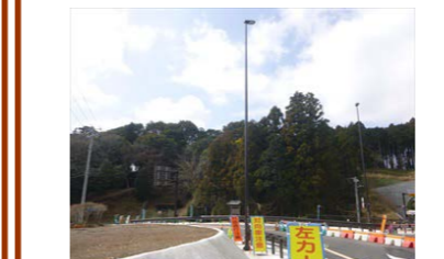
【照明灯設置イメージ写真】

お世話になっております。 新規工事を受注しました小林電気工業(株)です。主な工事内容は笹原山中バイパスにおいて照明灯の設置と附属する電源工事などを行います。 近隣皆様には工事車両通行などで、ご不便をおかけする事があるかとおもいますが、安全第一で作業をすすめる道路に明かりを取り付けたいと思いますので、ご理解とご協力をお願い致します。