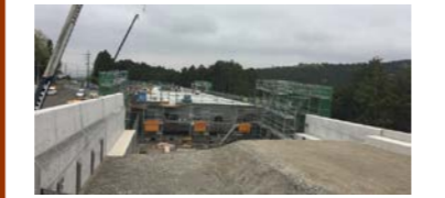
【箱根側から三島側を望む】

お世話になっております。 皆様のご協力により、先月で無事橋梁本体が完成いたしました。 今月の中旬以降には国道1号線からも橋梁の全景が見えるようになります。 今月は、橋梁と橋梁の前後の土の部分をつなぐ橋脚の胸壁と翼壁の施工を行います。 生コン車等の運搬車両の出入りには十分注意し、交通誘導員の合図のもと一般車両及び歩行者優先にて作業致しますので、ご理解とご協力をお願い致します。