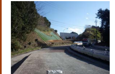
【中間点より起点側を望む】

お世話になっております。 新規工事を受注しました世紀東急工業(株)です。当工事の主な工事内容は、山中新田地区において舗装工・排水構造物工、道路付属施設工の施工を行います。舗装工事のため、道路の仕上げを行ってまいります。地域の皆様にとって、道路の仕上げを行ってまいります。地域の皆様にとって、快適に走っていただけるよう綺麗な道路を作りたいと思います。 今後工事が進むにつれて近隣の方々にはご不便をおかけする事があるかとおもいますが、安全第一、第三者優先、交通ルールの厳守で作業を進めてまいりますので、ご理解とご協力をお願い致します。