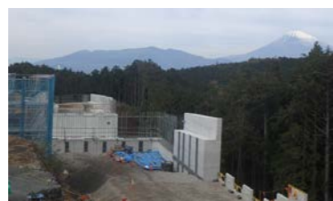
【箱根側より三島側を望む】

お世話になっております。 今月は、工事に必要である詳細な計画を立案します。また、現場休憩所の設営を行います。先月には山中新田にある法生寺の前に現場事務所を設営いたしました。今後、運搬車両の出入りもありますので、交通誘導員の合図のもと、一般車両及び歩行者優先で作業いたしますので、ご理解とご協力をお願い致します。