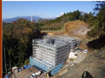
【4号橋A1橋台】 【8号,9号L型擁壁】 【4号函渠】

お世話になっております。 今月は、橋台躯体工の足場解体及び4号函渠の足場解体作業を行った後、埋戻し作業を進めて参ります。埋戻し作業時には、ダンプトラックの通行が増加します。国道1号及び農道通行の際は十分注意して走行願います。一般車両最優先、安全運転を心掛けますので、ご理解とご協力をお願い致します。