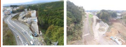
【エビノ木工区】 【笹原新田工区】

お世話になっております。 今月は一度休止していたU型擁壁の左壁の施工を行い、埋戻し後、L型擁壁の地盤改良工を行います。また、変更契約により工期がH31年3月20日まで延長になりました。この変更契約に伴い、笹原新田工区の施工も追加になっております。笹原新田工区では、路体盛土及び小段排水を施工してまいります。工事車両、重機の騒音等に十分注意しながらの作業を心掛けていきますので、ご理解とご協力をお願いします。