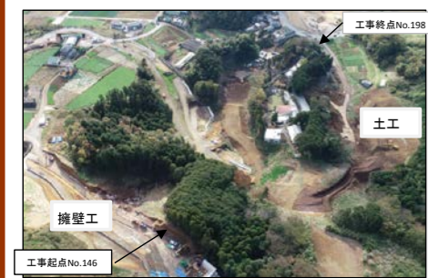
【土工】 【擁壁工】 工事終点No.198 工事起点No.146

お世話になっております。 今月は、擁壁工の基礎工事に着手し、土工では掘削が少しずつ進んでおります。工事の進捗に合わせ、工事用道路を通る車両も増えますが、交通誘導員を適切な場所での誘導、一般車両、地元優先と安全運転を心掛けますので、ご理解とご協力をお願い致します。