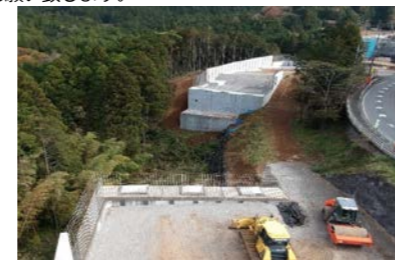
【三島側より箱根側を望む】

お世話になっております。 今月は、先月に引き続き工事の計画を進めていまして中旬から現場の施工を開始する予定にしております。作業内容といたしまして橋台の間に打設するコンクリートを支えるためのH鋼杭の建込みを打ち込んでいきます。施工にともないまして工事車両の搬出がでてまいります。交通誘導員により的確な合図を行い、一般車両及び歩行者優先で作業いたしますので、ご理解とご協力をお願い致します。