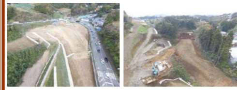
【大曲切回し道路】 【恵明学園起点側レベルバンク】

お世話になっております。 先月を持ちまして、当工事の切回し道路及び起点側レベルバンクの現場作業は完了しました。今月は検査準備等の測量作業及び後片付けを行ってまいります。最後まで安全作業を心掛けて参りますので、ご理解とご協力をお願い致します。