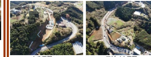
山中工区 エビノ木工区

お世話になっております。 山中工区ではカルバート躯体本体工事に着手し、鉄筋・型枠・コンクリート打設を行います。エビノ木工区では先月に引き続き道路幅幅・切替え工事を行います。材料搬入に伴い大型車両が頻りに通行しますが交通誘導員・作業員共に一般車両優先、安全第一で作業を進めて参ります。また、12月7,8日の二日間、車線切替に伴う片側交互通行規制を実施します。近隣住民の皆様にはご迷惑をお掛けしますが、ご理解とご協力をお願い致します。