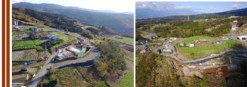
【6号函渠付近】 【5号函渠・13号補強土壁】

お世話になっております。 今月は6号函渠の足場の撤去、5号函渠の足場、型枠、鉄筋、コンクリート打設を行います。擁壁工では補強土壁のブロック設置や重力式擁壁の掘削、埋戻し、コンクリート打設を行う予定です。埋戻し土砂は終点側レベルバンクで改良を致します。コンクリートや資材、また土砂運搬等の大型車両が頻りに通行いたしますが、一般車両優先、交通ルールの厳守を心掛けますので、ご理解とご協力をお願い致します。