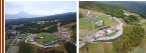
【全 景】 【6号函渠付近】

お世話になっております。 6号函渠のコンクリート打設は全て終了し、今月は5号函渠の鉄筋組立、型枠建込、コンクリート打設を行います。擁壁工は地盤改良、土砂掘削、補強土壁の施工、重力式擁壁の施工を行います。また恵明学園レベルバンク(終点側)では引続き土砂の搬入を行う予定です。土砂運搬や資機材搬入等、大型車両の出入りがありますが、交通ルールの厳守、安全運転及び一般車両優先を心掛けますので、ご理解とご協力をお願い致します。