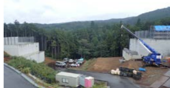
【国道1号より側面を望む】

お世話になっております。 9月末に受注しましたピーエス三菱と申します。本工事は、主にコンクリート製の橋を作る工事です。今月より、起工測量を行い詳細な計画を立案します。本格的に工事を開始するのは、来年からとなりますのでよろしくお願い致します。今後、近隣の皆様にはご迷惑をお掛けすることになるかと思われませんが、安全最優先で工事を進めてまいりますので、ご理解とご協力をお願い致します。