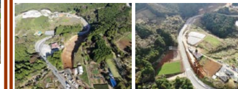
【山中工区】 【エピノ木工区】

お世話になっております。 山中工区では道路土工が終了し、11月よりボックスカルバートの床掘・置換を行います。エピノ木工区では掘削、路床置換を行います。土砂運搬及び材料搬入に伴い大型車両が頻りに通行しますが交通誘導員・作業員ともに一般車両優先、安全最優先で作業を進めて参ります。また、情報BOX切回し工事に伴い12日より大曲2箇所路肩・歩道規制、19日より見晴学園前～スカイウォーク入口付近の間で片側交互通行規制を実施します。近隣住民の皆様にはご迷惑をお掛けしますが、ご理解とご協力をお願い致します。