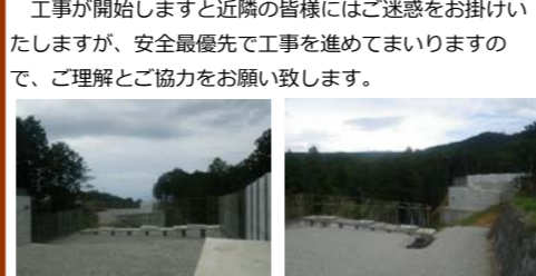
【箱根側より三島側を望む】 【三島側より箱根側を望む】

お世話になっております。 9月末に受注しました極東興和と申します。本工事は、主にコンクリート製の橋を作る工事です。今月より、測量を行いまして施工に向けての計画を進めております。工事を開始するのは、12月初旬あたりからH鋼杭の打ち込み作業を行う予定ですのでよろしくお願い致します。工事が開始しますと近隣の皆様にはご迷惑をお掛けいたしますが、安全最優先で工事を進めてまいりますので、ご理解とご協力をお願い致します。