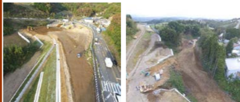
【切回し道路】 【レベルバンク・本線側】

お世話になっております。 今月も引き続き大曲切回し道路は土砂を受け入れながら土質改良による路体盛土の施工を行ってまいります。現場付近では大型タンク車両及び固化材運搬車両が頻りに通行しますが交通誘導員を適切な場所に配置し、一般車両優先と安全運転を心掛けますので、ご理解とご協力をお願い致します。