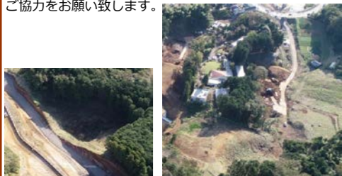
【擁壁工 No.147-No.150着手前】 【道路土工No.181-No.198着手前】

お世話になっております。 先月は、除草作業と起工測量を行い、今月より本格的に擁壁工事と、本線部の道路土工の掘削にかかります。残土搬出を予定していますので第三者優先、法規遵守で作業を行います。近隣の皆様にはご迷惑をお掛けしますが、一般車両優先、安全最優先で工事を進めて参りますので、ご理解とご協力をお願い致します。