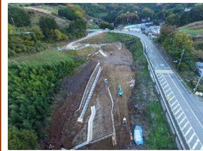
11月末 大曲工区 路体盛土