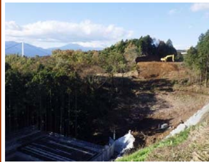
11月末 4号橋 A1橋台

近隣の方々にはご迷惑をお掛けしますが、一般車両優先、安全運転を心掛けますので、ご理解とご協力をお願いします。