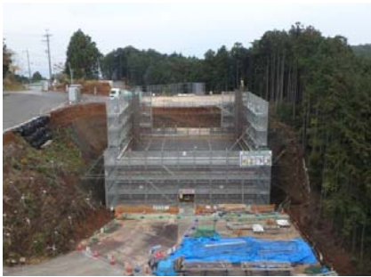
11月末 2号橋 A2橋台

2号橋A2橋台の施工は順調に進んでおり、12月22日に最後のコンクリート打設を予定しています。近隣の皆様にはご迷惑をお掛け致しますがご理解とご協力をお願いします。