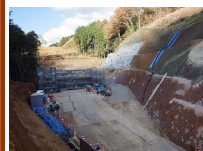
11月末 4号橋 A2橋台