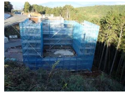
11月末 2号橋 A1橋台

これも地域の皆様のご理解とご協力によるものと心から感謝しております。有難う御座いました。