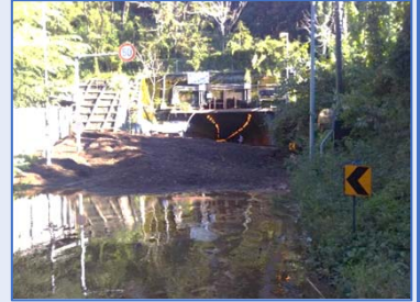
災害発生時の様子