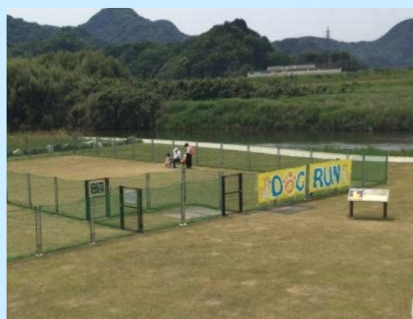
ドッグランの利用（令和元年5月）