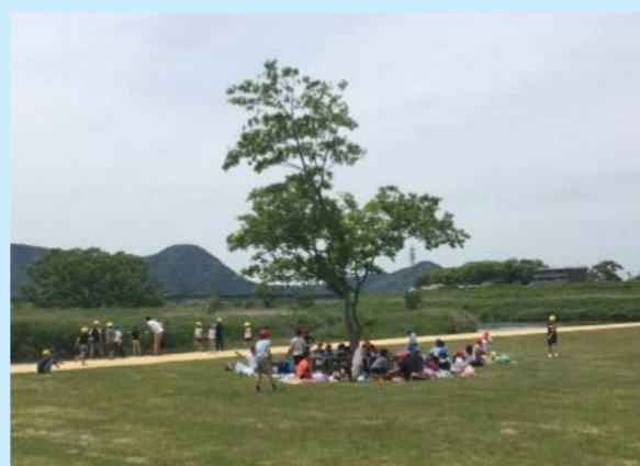
地元の子供たちによる利用（令和元年5月）