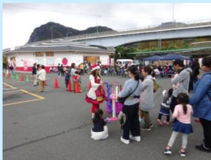
道の駅伊豆のへそ 1周年イベント（令和元年11月）