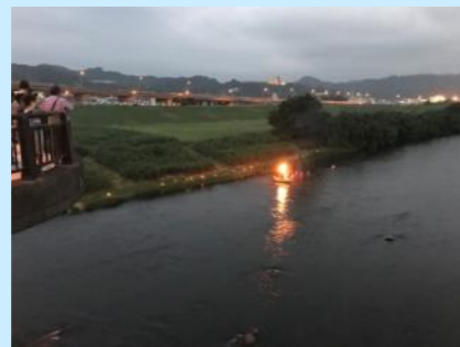
かわかんじょう （令和元年8月）