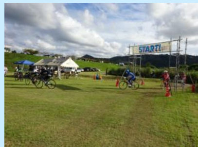
サイクリング（ライド &ライド狩野川） （令和元年9月）