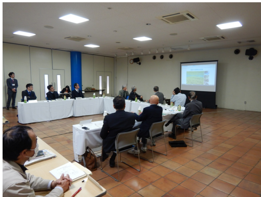
第15回柿田川自然再生検討会(R1.12.5)