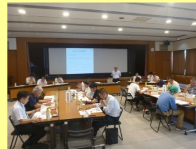
第2回作業部会 （令和元年8月22日開催）