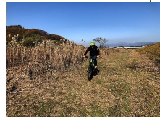
自転車オフロードコース 試走状況