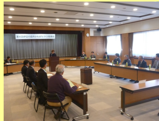
第4回協議会 （令和元年12月20日開催）