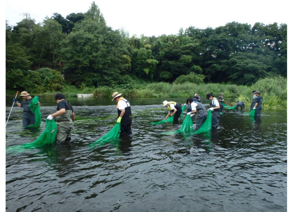
ボランティア参加による外来種駆除