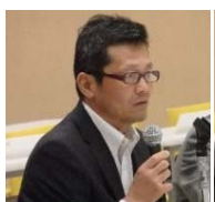
静岡県危機管理部 理事