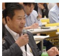
静岡県 河川砂防局長