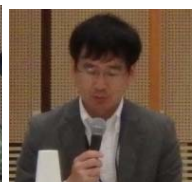
静岡地方 気象台長