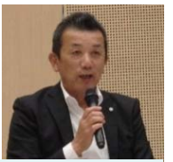
富士山南東 消防長