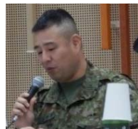
陸上自衛隊第34 普通科連隊 第3科長