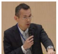
静岡県警察本部 災害対策課長