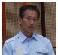
御殿場市・小山町 広域行政組合 消防長