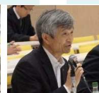
沼津土木 事務所長