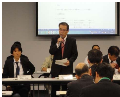
連絡会・協議会開催挨拶