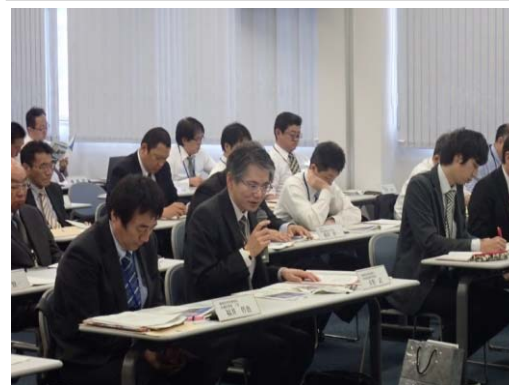
各機関からの取組報告