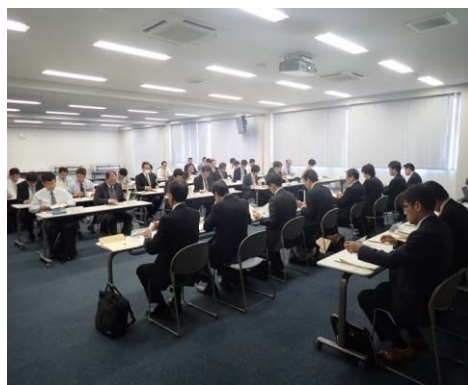
連絡会・協議会の実施状況