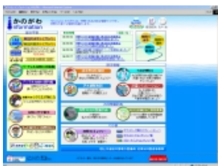
HP「インフォメーションかのがわ」

流域一体となった狩野川の川づくりを進めていくため、地域住民が主体となった狩野川の川づくりを支援しつつ流域ネットワーク構築を目指す。