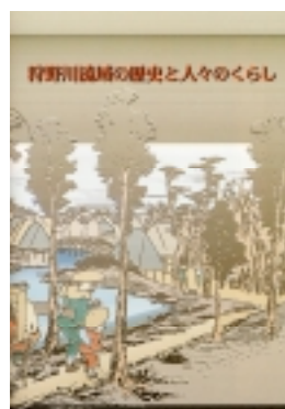
各種パンフレット