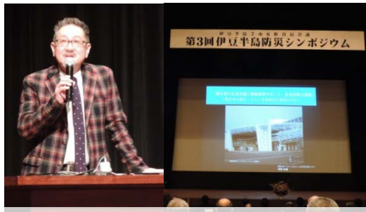
福島大学うつくしまふくしま未来支援センター客員准教授の基調講演 「被災者の生活支援と用配慮者サポート、自治体間の連携」 ～ 東日本大震災・ふくしま避難所の運営に学ぶ～

『生きがいと居場所づくり』が、避難所の運営には必要である。 ふくしま避難所では、住民の交流と自治活動を行う「おだがいさまセンター」が開設された。