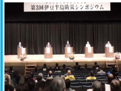
〈テーマ〉多様な避難所運営 ～地域の生活者と観光交流客の保護～