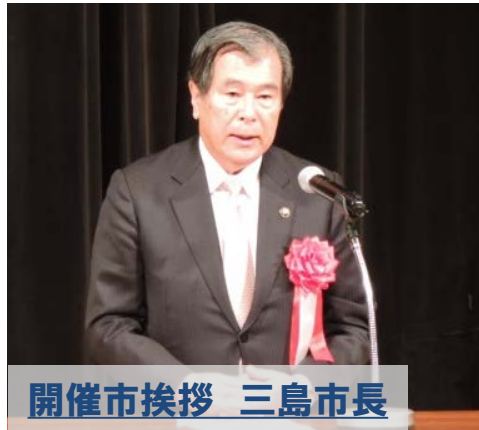
開催市挨拶 三島市長

11月25日(水)三島市民文化会館にて、伊豆半島7市6町首長会議 第3回伊豆半島防災シンポジウムが行われました。シンポジウムでは、基調講演・プレゼンテーション・パネルディスカッションが行われ、事務所長がプレゼンターとして『国土交通省の災害対応～TEC-FORCEの役割と活動～』について説明しました。