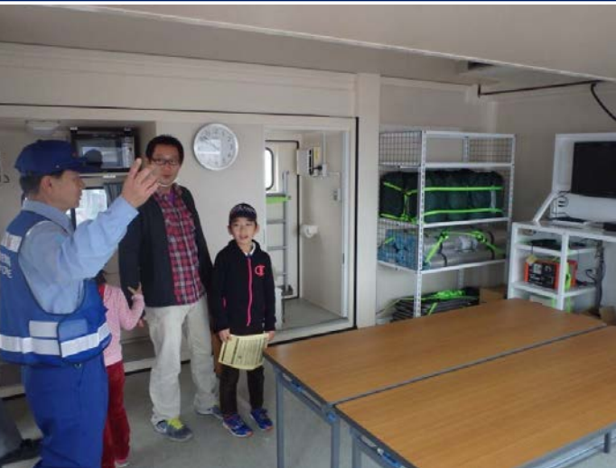
対策本部車内部での機能説明

11月14日(土)、ふじさんメッセ(富士市)で開催された「ふじbousai2015」に参加し、TEC-FORCEの災害対応や南海トラフ巨大地震をテーマとしたパネルや対策本部車・照明車を展示しました。