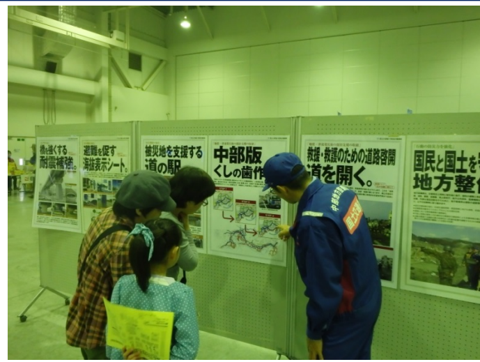
南海トラフ巨大地震に備える パネル展示

防災グッズの展示説明、応急救護体験の他に自衛隊や消防署の車両などが展示されていました。