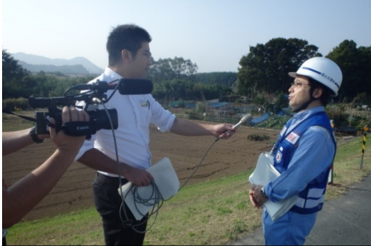
取材を受ける調査第一課長 10月22日