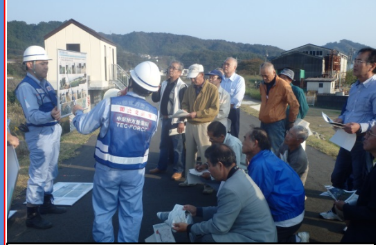
常総市での災害状況や出水時対応等説明 10月22日