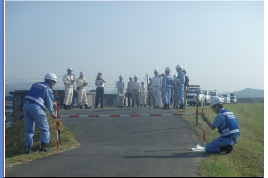
点検 堤防の余裕高が不足箇所の確認 10月22日