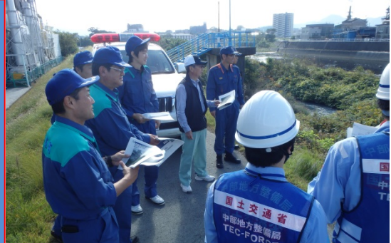
点検 堤防状況確認 10月27日

記事の詳細については河川担当副所長(TEL:055-934-2001)にお問い合わせ下さい。