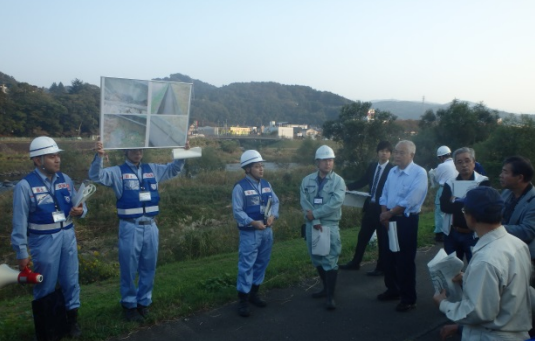
点検 過去に漏水があった箇所の確認 10月22日