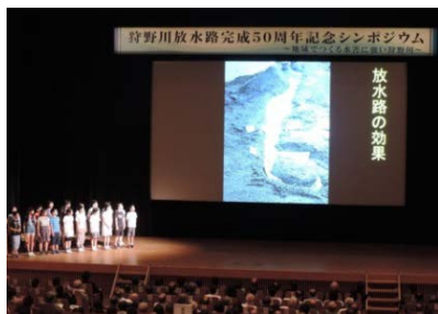
狩野川放水路完成50周年記念シンポジウム

狩野川での河川改修事業による治 水安全度の向上(ストック効果説明) : 沼津河川国道事務所長