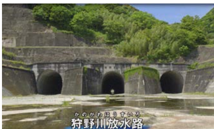
かのがわ国境を穿つ 狩野川放水路