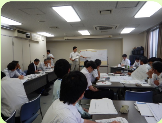
堤防決壊時の緊急対策シミュレーション 検討結果を発表