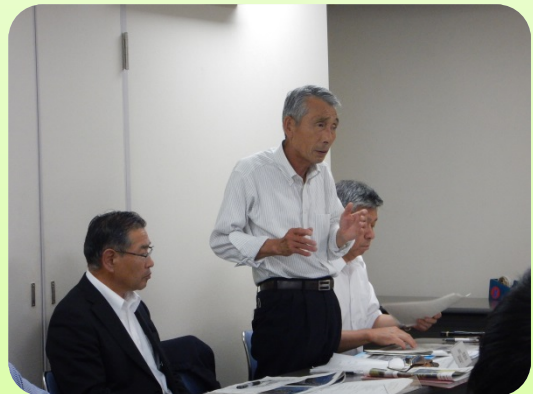
河川工法技術伝承研究会による講評

日頃から狩野川の特長や重要水防箇所、備蓄資機材の状況の把握をしておくことが災害時の適切な対応に繋がります。