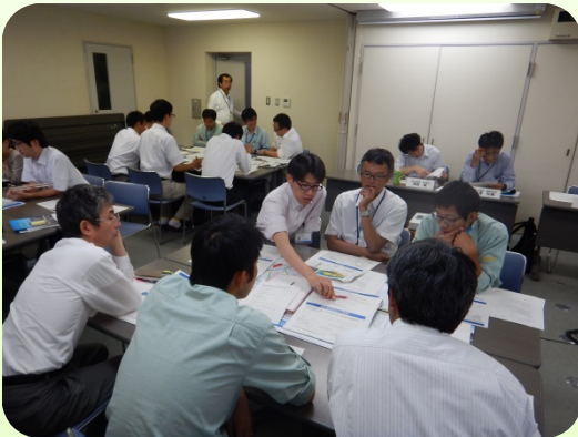
昨年の成果をグループ毎に再検討している様子

狩野川における水防における課題を踏まえ、グループで討議を行い、資材の調達先や緊急対策方法等について検討しました。