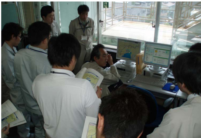
操作説明をする工務第二課長

我入道第1～第6陸閘、江川樋管、西島第1第2樋管及び川瀬樋管は、平常時は開いていますが、震度6弱以上の地震発生時又は津波注意報等発令時には内陸への浸水を防ぐため自動閉鎖します。しかし、万が一自動閉鎖しなかった場合には、遠隔操作によって閉鎖することが可能です。なお、この遠隔操作システムは、沼津河川国道事務所、出張所及び沼津市役所に設置されています。