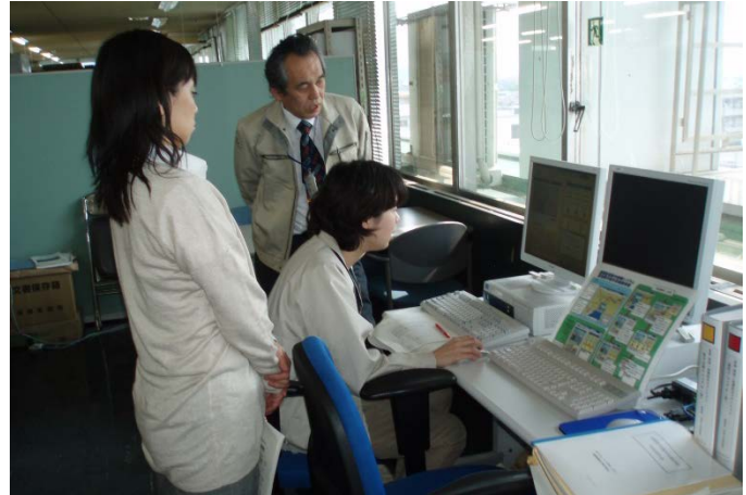
実際に遠隔操作訓練を行う沼津市職員