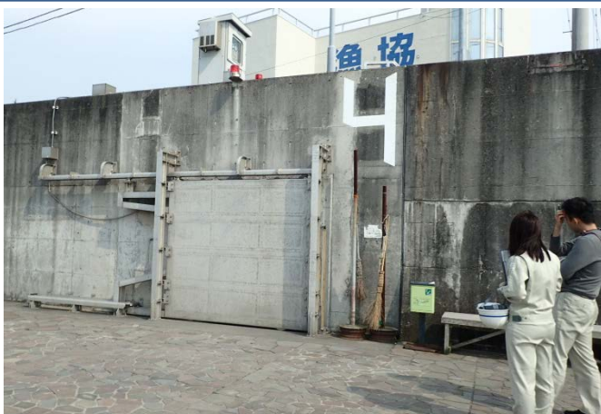
沼津河川出張所の係長が現地で閉鎖を確認