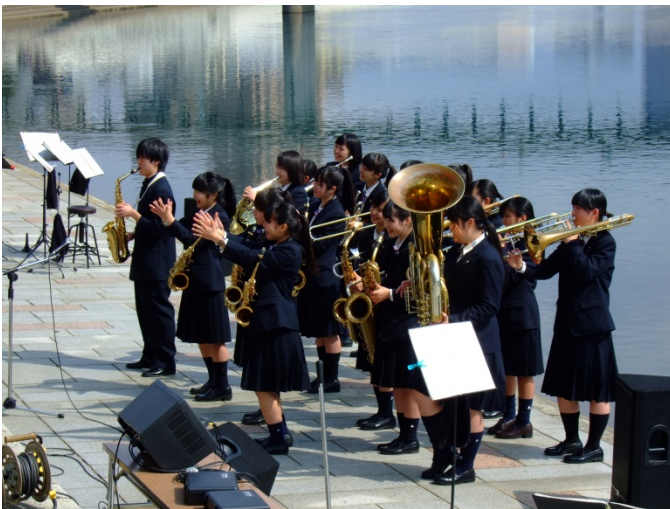
・沼津商業高校ブラスバンド部による演奏♪

3月15(日)沼津市上土町「かのがわ風のテラス」にて第3回目となる狩野川ローカルマーケットが開催されました。会場では、狩野川流域の美味しいこだわりのある逸品が多数販売され大盛況。当日は狩野川堤防をコースとしたリレーマラソン、上土商店街の稲荷市もあり、風のテラスではカヌー体験教室、地元高校ブラスバンド部の演奏等もあり楽しい春の1日となりました。