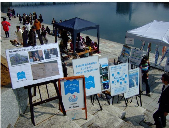
・特設ミズベリングパネル展示