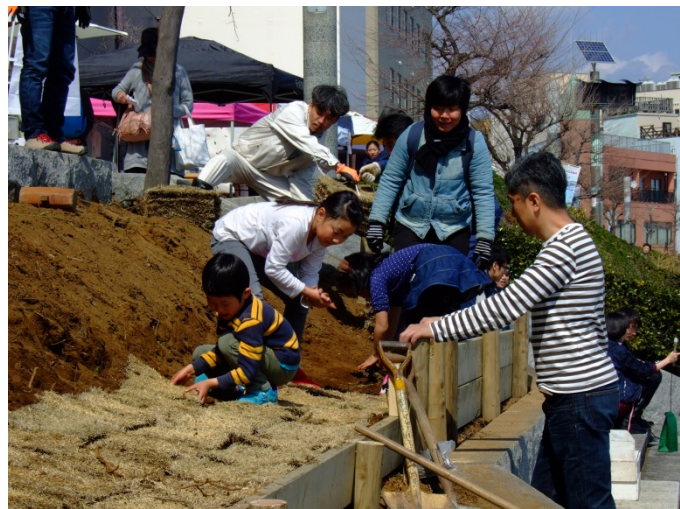
・子どもによる植栽帯の芝生張りも実施