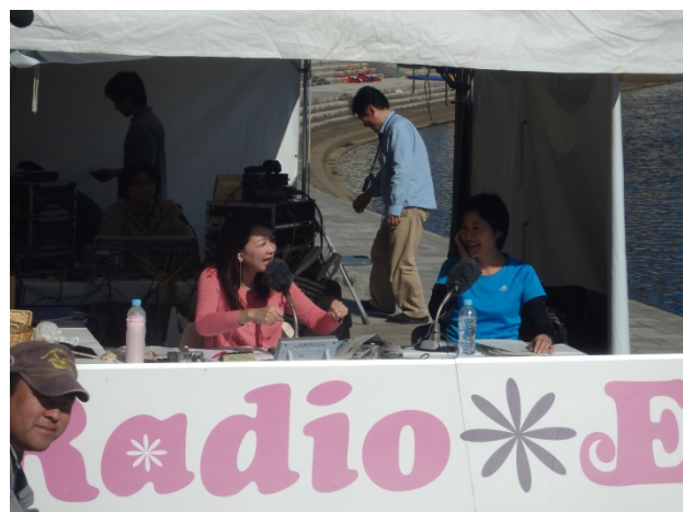
レース後にSBSラジオ「Radio * East」の公開生放送に出演する事務所長

記事の詳細については(河)副所長(TEL:055-934-2001)にお問い合わせ下さい。