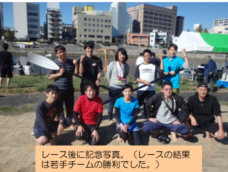
レース後に記念写真。(レースの結果は若手チームの勝利でした。)