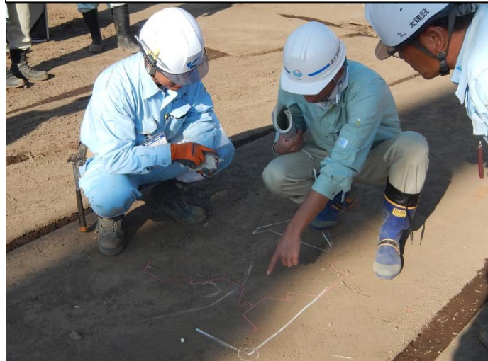
熱心に質問する若手職員