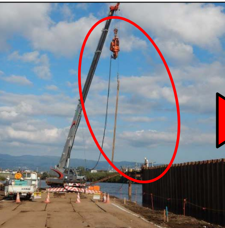
ラフタークレーン(25t)にて、 工事用作業ヤードより鋼矢板を吊込