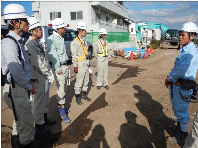
施工の説明を受ける若手職員