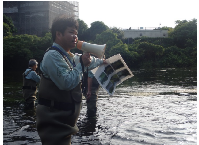
ミシマバイカモ発育状況現場説明