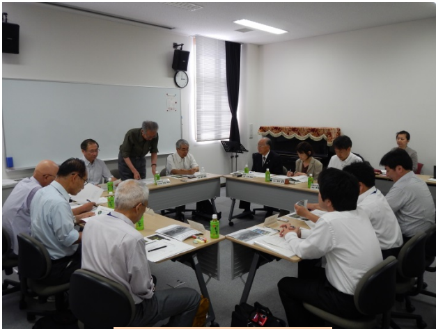
検討会の開催状況

今回の検討会では、平成26年度の調査方法や河岸洗掘対策等の実施内容について議論を行いました。また、現在の柿田川の状況を把握するため、委員の方々による現地視察も実施しました。