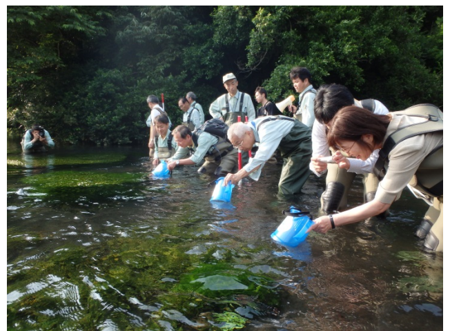
ミシマバイカモ発育状況視察

各委員からは、継続的な外来種駆除活動をすることによってミシマバイカモの生育がよくなってきているという意見を頂き、その成果を現地で確認することができました。他にも様々な意見を頂き、平成26年度の実施計画について承認されました。