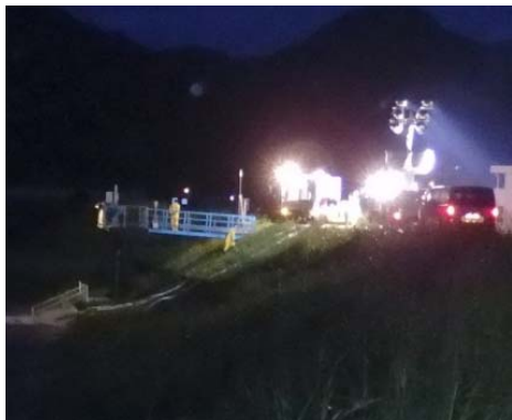
近年の排水ポンプ車稼働実績 (H29: 台風21号(三島市御園地区))