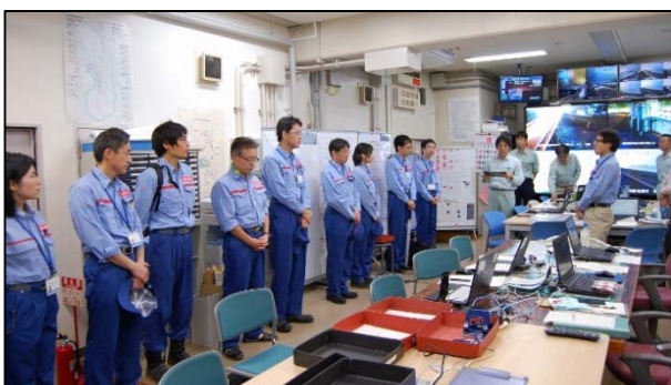
リエゾン派遣状況 (H30: 台風24号: 出発式)