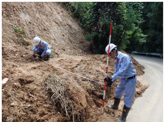
現地調査の様子(H30: 平成30年7月豪雨)

大規模自然災害の発生や又は発生するおそれがある場合に被災した自治体等に対して、被災状況の迅速な把握、被害の発生及び拡大防止、被災地の早期復旧等、またその他の災害応急対策に対する技術的な支援を行います。