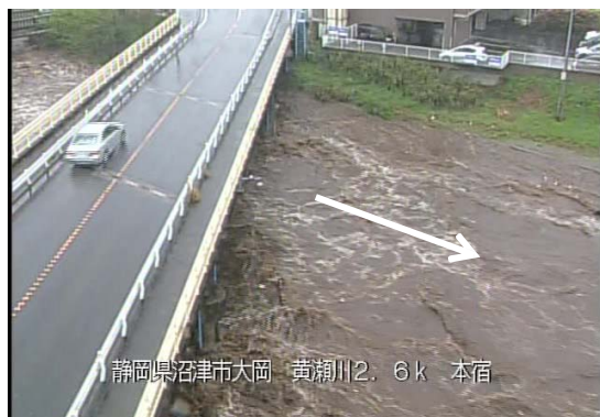
ほんじゆく きせがわ 本宿水位・流量観測所(黄瀬川)

近年の集中豪雨や自然災害に備えるため、管内にリアルタイムな降雨状況を把握できるXバンドレーダーや雨量観測所20箇所及び河川水位観測所15箇所を設置し、降雨状況や水位状況及びCCTVカメラ51箇所により河川・海岸の状況把握を常時実施しています。また、収集したデータより水防団や一般住民に対して水防警報・洪水予報をはじめとする各種予警報及び海岸水防警報を発令し迅速な情報提供を行っています。なお、インターネットを通じ雨量・水位情報の提供を行っています。