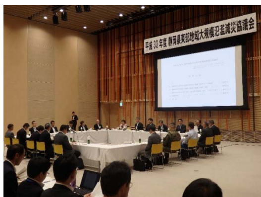
静岡県東部地域大規模氾濫 減災協議会(5月)